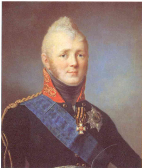
С. Щукин. Портрет Александра I

ные науки, в особенности те, что касались артиллерии. В этих дисциплинах он находил «утешение и приятное занятие, сходное с расположением моего духа».