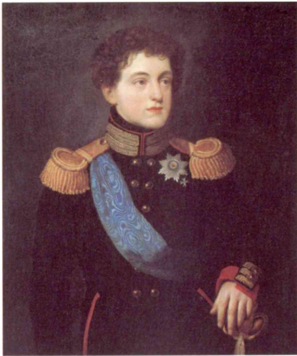
О. Кипренский. Портрет великого князя Николая Павловича

логику, политическую экономию, естественное право. Учить ему также пришлось несколько языков — немецкий, французский, латинский и греческий. Еще он занимался каллиграфией, рисованием, танцами, музыкой и верховой ездой.