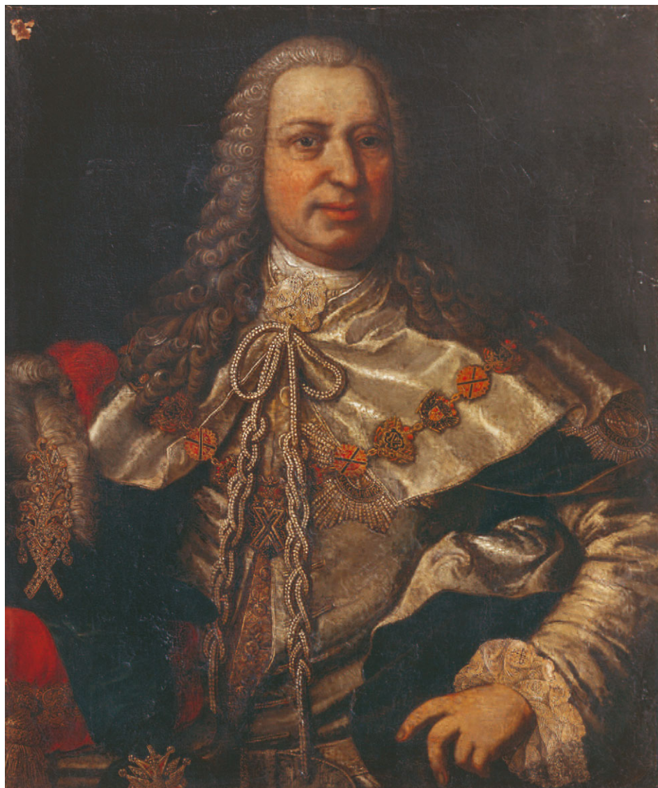
3. М.-К.-Э. ХАГЕЛЬГАНС Портрет графа Г.К. Кейзерлинга. 1758 Холст, масло. 90 x 70