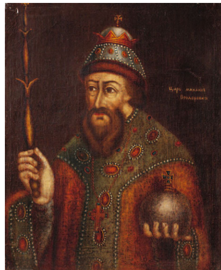
2. Неизвестный художник Портрет царя Михаила Федоровича Романова Конец XVIII века Холст, масло. 45 x 36

В 1920–1930-е годы в Пушкинский Дом из Правления ленинградского отделения Академии наук было передано собрание так называемых «академических портретов»,