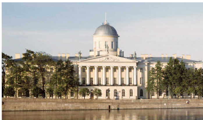
Пушкинский Дом Фотография

Начальный этап его существования ознаменован исключительно собирательской деятельностью. Среди первых поступлений – многочисленные дары от частных лиц. Первым приобретением стала библиотека А.С. Пушкина, купленная Академией за 18 тысяч рублей. В 1909 году за счет казны был приобретен парижский музей А.Ф. Онегина (Отто) – одно из крупнейших историко-литературных собраний. В 1917 году коллекции Дома пополнились собраниями Пушкинского музея упраздненного Александровского лицея, а также Лермонтовского музея при Николаевском кавалерийском училище. Его коллекция составляет важнейшую часть лермонтовского фонда Пушкинского Дома, наиболее полного по содержанию и значительного по объему из всех существующих лермонтовских собраний.