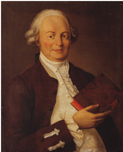
5. Неизвестный художник Портрет В.К. Тредиаковского. 1800-е Холст, масло. 80 х 65

Портрет поэта и теоретика стихосложения Василия Кирилловича Тредиаковского (1703–1768) так же происходит из собрания Российской академии. С 1733 года он служил переводчиком в Академии наук, где написал трактат «Новый и краткий способ к сложению российских стихов» и в 1745 году был удостоен звания академика. Высокую оценку Тредиаковскому как реформатору и теоретику стиха дал А.С. Пушкин: «Его филологические и грамматические изыскания очень замечательны. Он имел о русском стихосложении обширнейшее понятие, нежели Ломоносов и Сумароков... Вообще изучение Тредиаковского приносит более пользы, нежели изучение прочих наших старых писателей». Портрет Тредиаковского выполнен неизвестным художником для зала заседаний Российской академии. Он восходит, вероятно, к гравюре А.Я. Колпашикова, опубликованной в первом издании «Деидамии» Тредиаковского 1775 года.