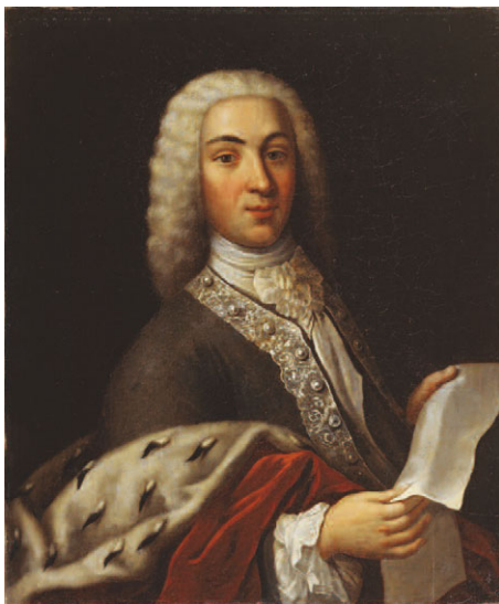
1. Неизвестный художник с оригинала Я. Амигони 1735 Портрет князя А.Д. Кантемира Вторая половина XVIII века Холст, масло. 75 x 63

Живописную галерею Литературного музея ИРЛИ открывает портрет царя Михаила Федоровича (1596–1645). Во время его правления (1613–1645) началось сближение русской и западноевропейской культур. В 1633 году в Россию прибыл придворный библиотекарь герцога Голштинского, ученый и путешественник Адам Эльшлегер, взявший псевдоним Олеарий. В «Описании путешествия в Московию и через Московию в Персию и обратно» он оставил подробные географические и исторические сведения о России. Его сочинение проиллюстрировано картами и рисунками, среди которых гравированный портрет царя Михаила Федоровича. Иконография царя Михаила Федоровича обширна. Большинство изображений, как и представленный портрет, восходят к известной гравюре А. Олеария 1647 года.