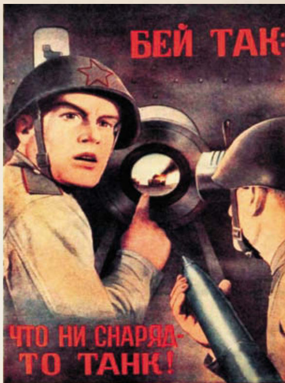
Советский плакат времен Великой Отечественной войны