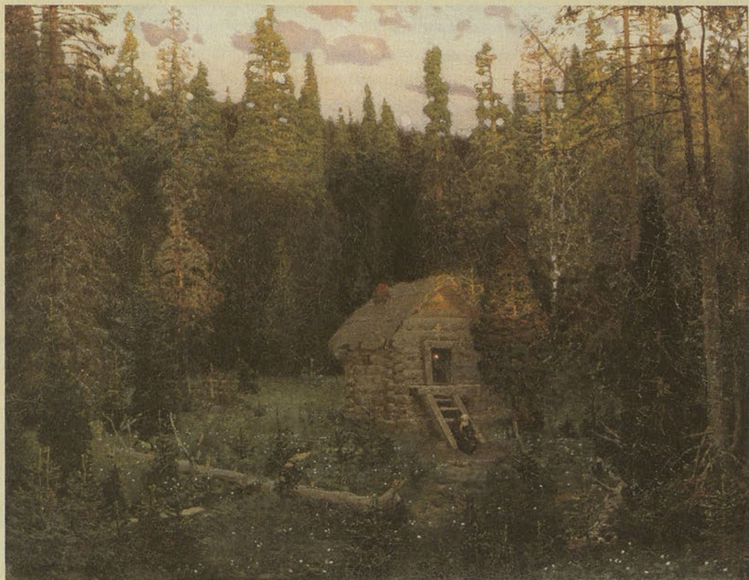
А. Васнецов. Скит

Семья обычно жила в бревенчатой избе с одной для всей семьи комнатой. Изба служила для защиты от непогоды и холода, поэтому двери и окна имели минимально необходимые размеры. Окно размером с сегод-