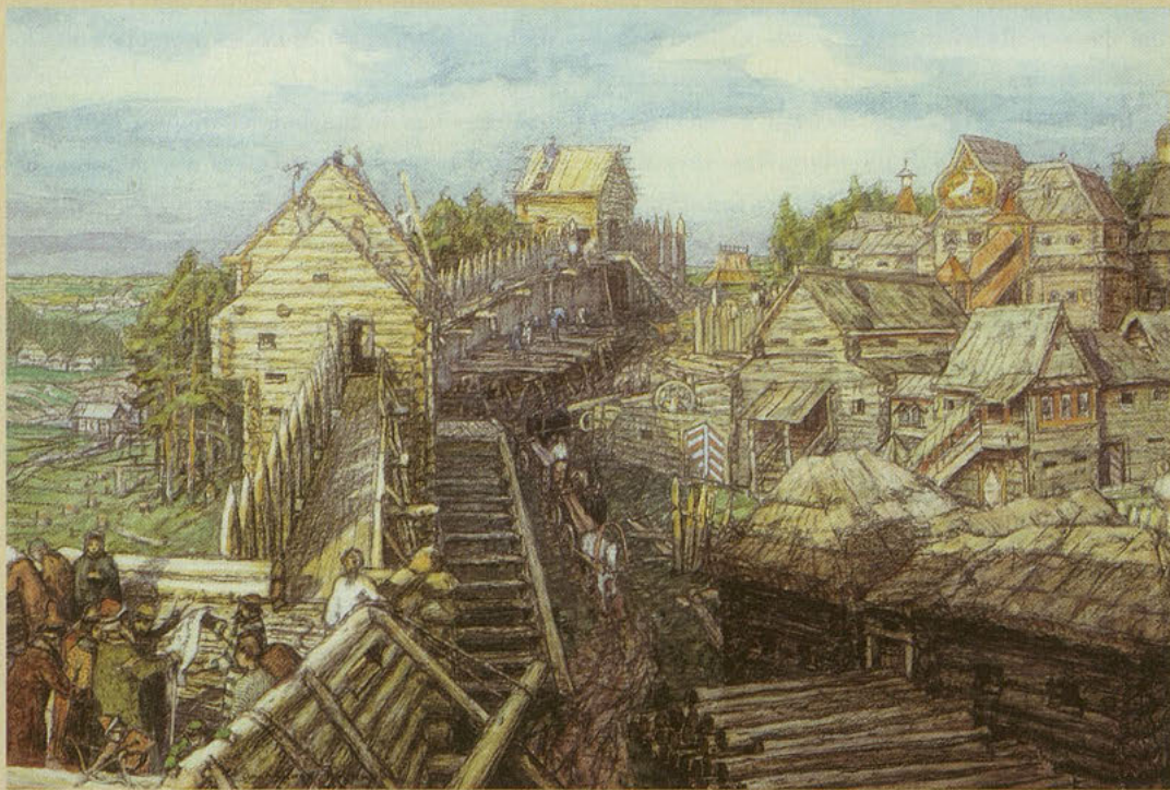
А. Васнецов. Строительство деревянных стен Кремля

Точная дата рождения Даниила Московского неизвестна. В древней рукописной Лаврентьевской летописи записано, что в 769 году «родися Олександрю сынъ, и нарекоша имя ему Данилъ». Описанный период приходится на март-февраль 1261 года современного летоисчисления.