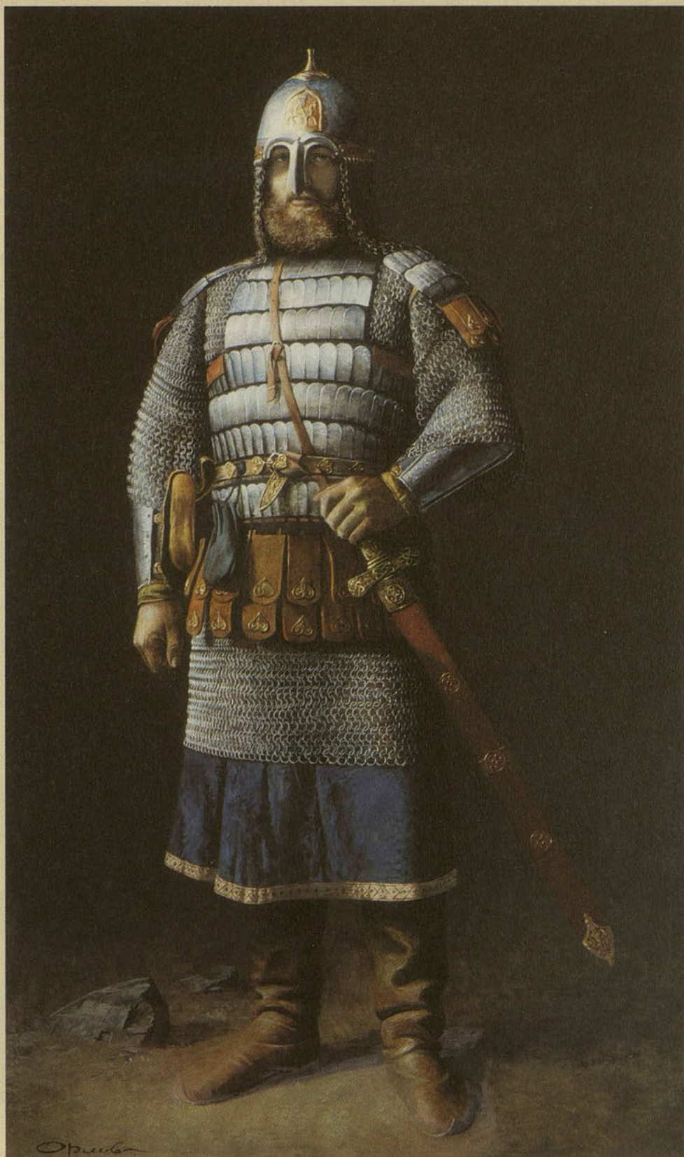
Ю. Орлов. Князь Юрий Долгорукий