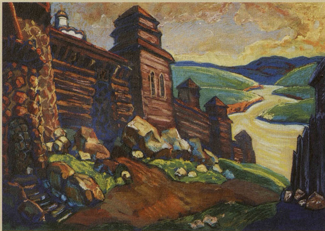
Н. Рерих. У стен старого города

Постоянная угроза нашествия, смерти, плена, разорения воспитывала особый характер живших здесь людей — пахарей с мечом в одной руке. Но эта же открытость равнины