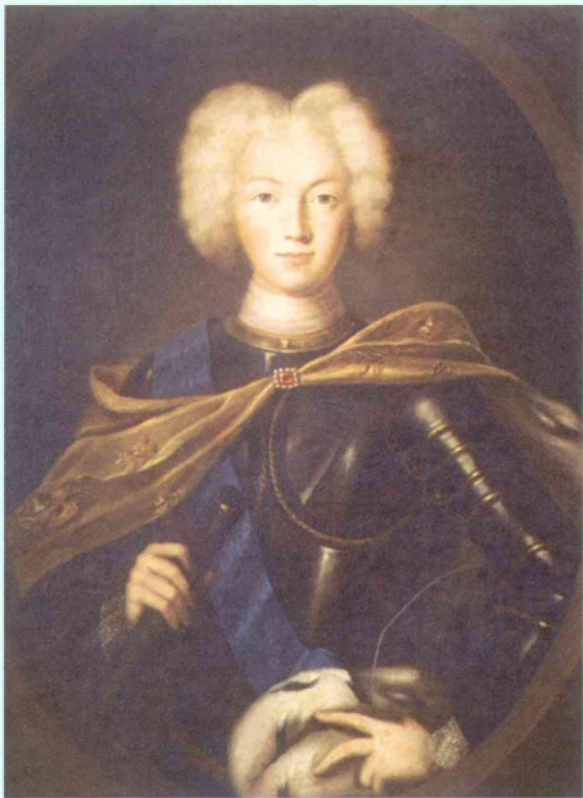
Неизвестный художник Портрет императора Петра II

Когда маменька Елизаветы, Екатерина I, умерла, Петр, внук Петра Великого, царем стал. Значит, стал Петром II. Лицом он был мил и нравом добр. Охотиться любил и своим собакам охотничьим сам пищу готовил. А управлять государством, конечно же, еще не умел. За него это разные князья делали, и каждому князю хотелось свою дочку замуж за Петра выдать, чтоб царицей она стала. Ох и ссорились между собой князья эти! Наконец решили женить его на княжне Екатерине Долгорукой. Невесте 18 лет, а жениху-то — 14. Обручили их и стали к свадьбе готовиться.