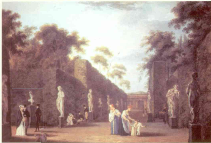
Неизвестный художник Летний сад

А в жены он взял принцессу английскую. Подумаешь! У Елизаветы женихов и без него хоть отбавляй. Даже Петр, племянник ее, влюбился. А было-то ему всего 12 лет.