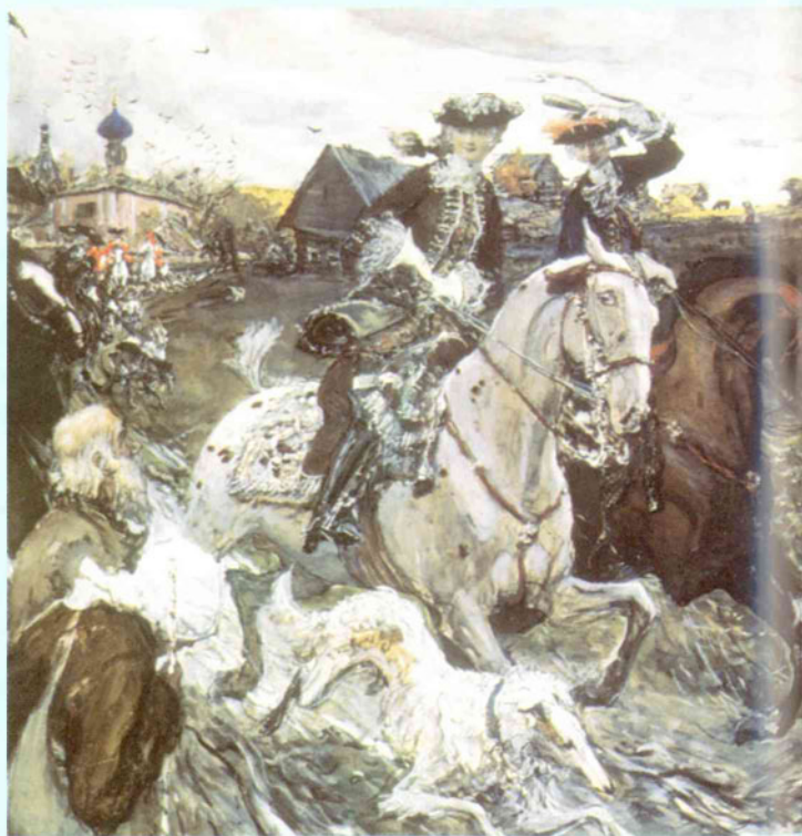
В. Серов. Петр II и цесаревна Елизавета на псовой охоте

И еще вот такая потеха у нее была. Сидит, бывало, у окна, в руках ружье держит, а когда ласточки да воробушки мимо окна пролетали, она по ним... стреляла!