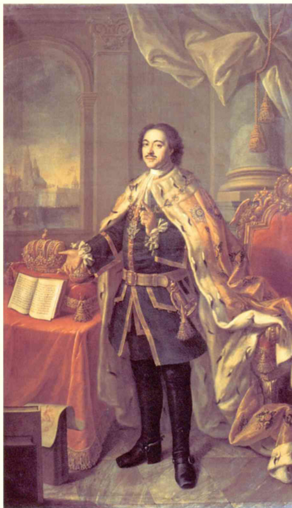
А. Антропов. Портрет Петра I