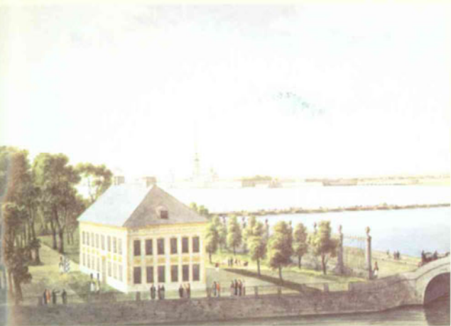
А. Мартынов Дворец Петра I в Летнем саду