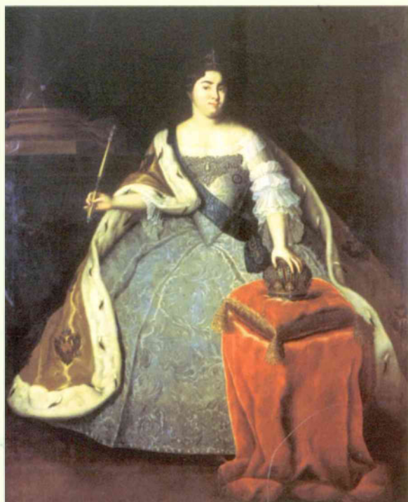
Неизвестный художник Портрет Екатерины I