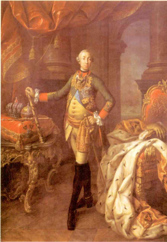
А. Антропов. Портрет Петра III