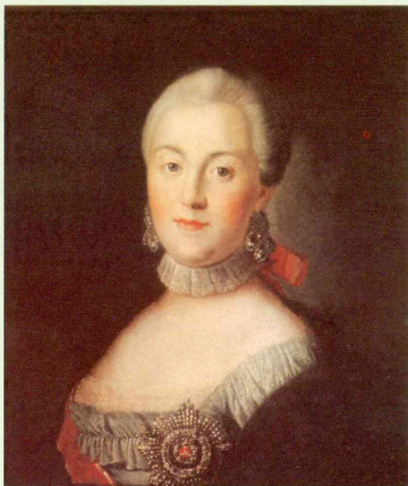
А. Антропов Портрет великой княгини Екатерины Алексеевны

У Фике к тому времени был жених. Умный, красивый — гораздо лучше нескладного Петра III. Но на голове несимпатичного Петра она уже представляла царскую корону. Когда ехала в далекую, неведомую Россию, думала: «Или умру, или буду царствовать!»