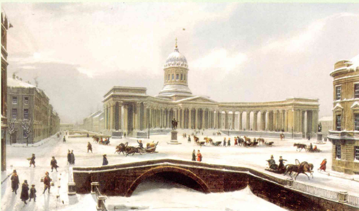
Ф. Арну. Казанский собор