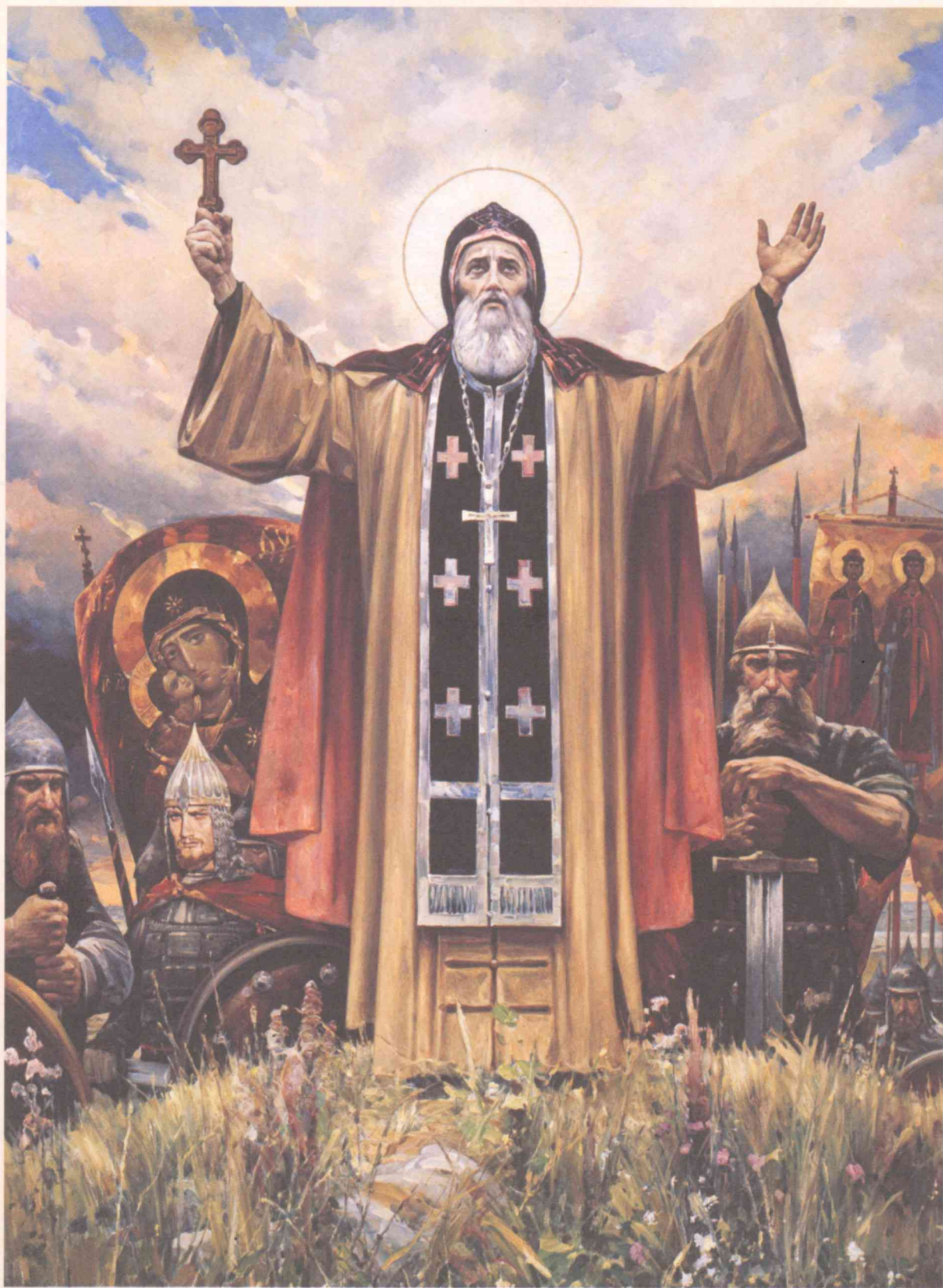
В. Нестеренко. Игумен земли Русской