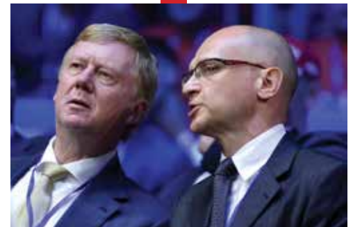
Анатолий ЧУБАЙС, Сергей КИРИЕНКО