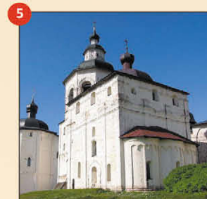
5 Церковь Архангела Гавриила