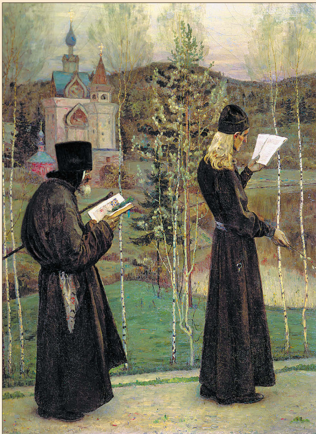
Монахи. М. В. Нестеров