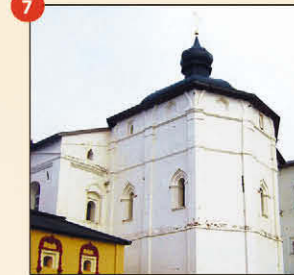
7 Церковь Введения Пресвятой Богороди- цы во Храм