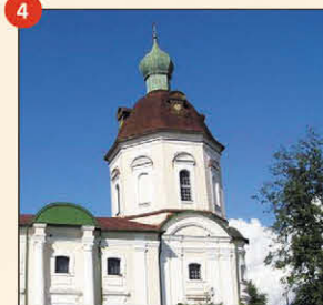
4 Кирилловская церковь