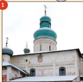
1 Успенский собор с папертиями