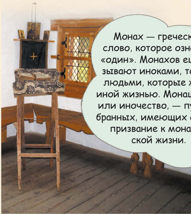
Келья монаха в монастыре

Монах — греческое слово, которое означает «один». Монахов ещё называют иноками, то есть людьми, которые живут иной жизнью. Монашество, или иночество, — путь избранных, имеющих особое призвание к монашеской жизни.