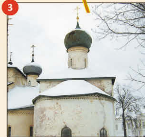
3 Епифаниевская церковь