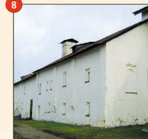
8 Поварня с погребами