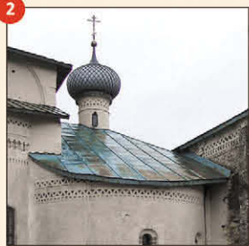
2 Владимирский собор