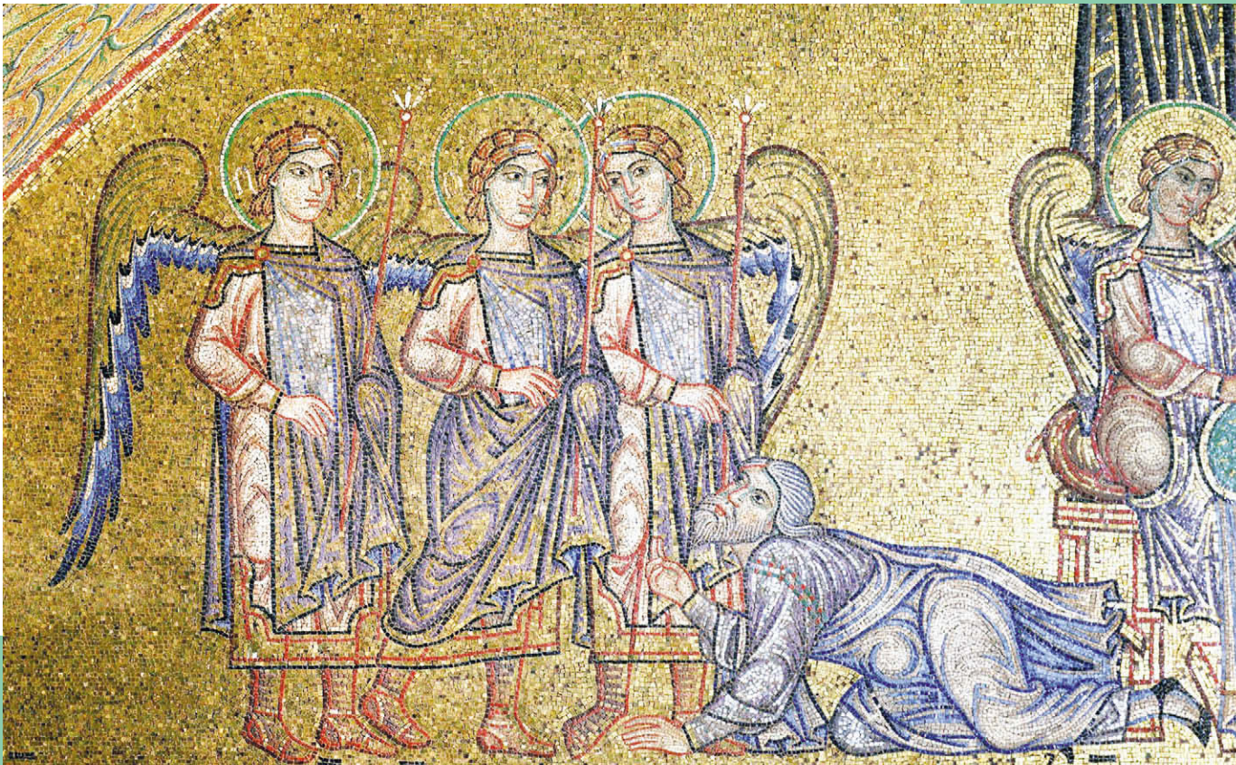
Явление Господа Аврааму. Мозаика XIII в.