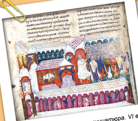
Скиния Завета. Книжная миниатюра. VI в.

если вы будете слушаться гласа Моего и соблюдать завет Мой, то будете Моим уделом из всех народов, ибо Моя вся земля, а вы будете у Меня царством священников и народом святым (Исх. 19, 5–6).