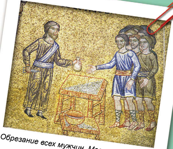
Обрезание всех мужчин. Мозаика. XIII в.

Завет Бога с Авраамом уже касается не всего мира, а одного рода, исходящего от Авраама через Исаака и Иакова. Эти патриархи, избранные сохранить правильное представление о Боге, получают уверение, что народ, который произойдет от них, будет источником благословения, спасения для всех племен земли. Потомки Авраама должны получить в обладание землю сию, от реки Египетской до великой реки, реки Евфрата (Быт. 15, 18–20), Авраам станет отцом множества народов, а Господь будет Богом ему и его потомкам, рожденным от Сарры. Как знамение завета Бог установил обрезание всякого младенца мужского пола. Позже, когда Израиль совершает греховные преступления, Бог наказывает его, но Он не хочет разрушить завет (Лев. 26, 44). В уверенности, что Бог вечно помнит завет Свой, слово, [которое] заповедал в тысячу родов (Пс. 104, 8), Израиль не раз в своей истории взывал к Нему: Призри на завет Твой... (Пс. 73, 20).