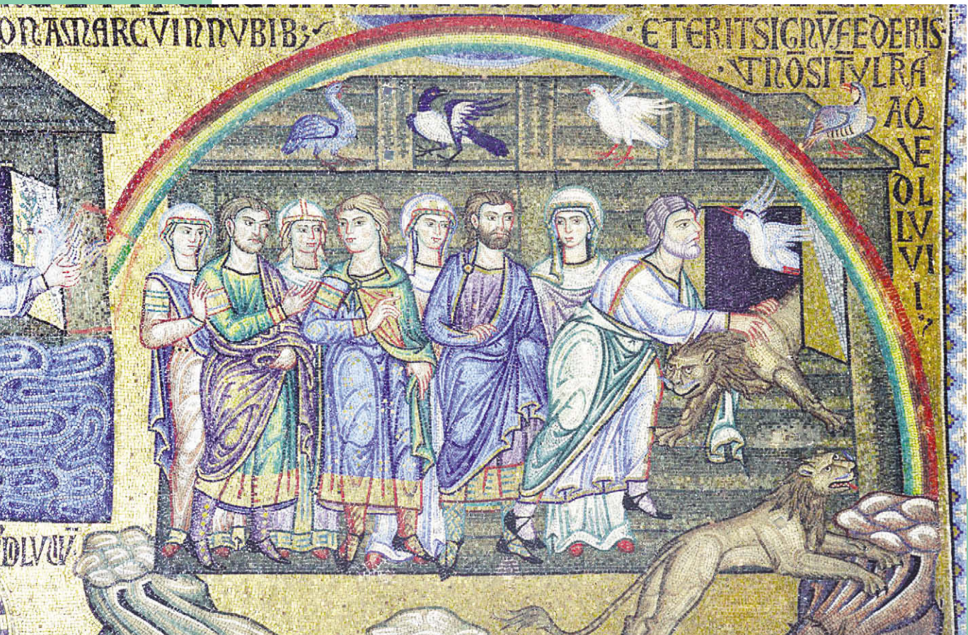
Ной и семья выходят из ковчега Мозаика. XI в.

Такой же всемирный характер, как и завет с Адамом, имеет завет Бога с Ноем. Из развращенного человечества Господь избирает праведного Ноя и спасает его от вод потопа. С родоначальником нового человечества, его потомством и со всякою душою живою Бог утверждает великий завет