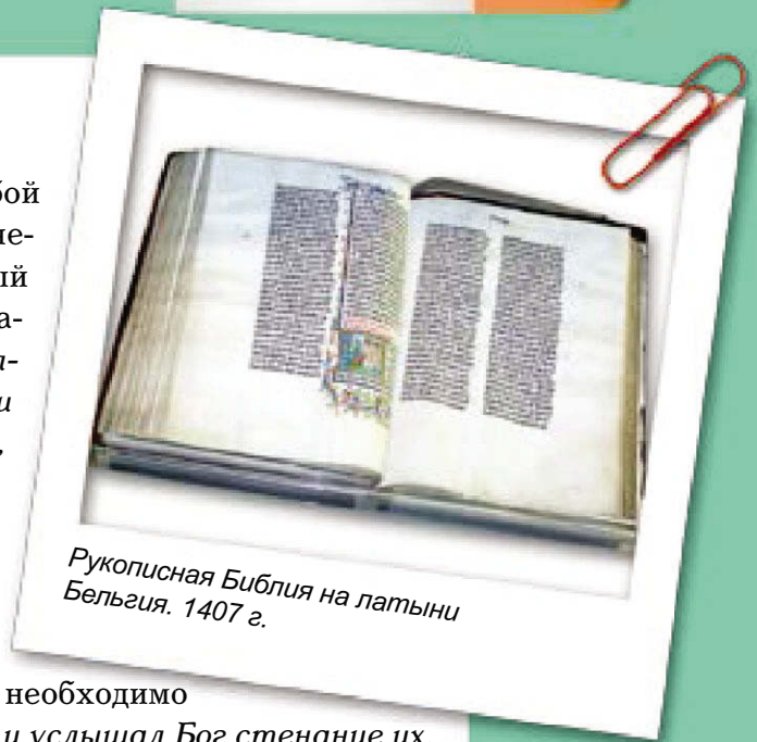
Рукописная Библия на латыни Бельгия. 1407 г.

Израиль в своих молитвах чаще всего обращался к Богу с прошениями, чтобы Он вмешался в жизнь нуждающихся и беспомощных. Часто это ходатайства за других: