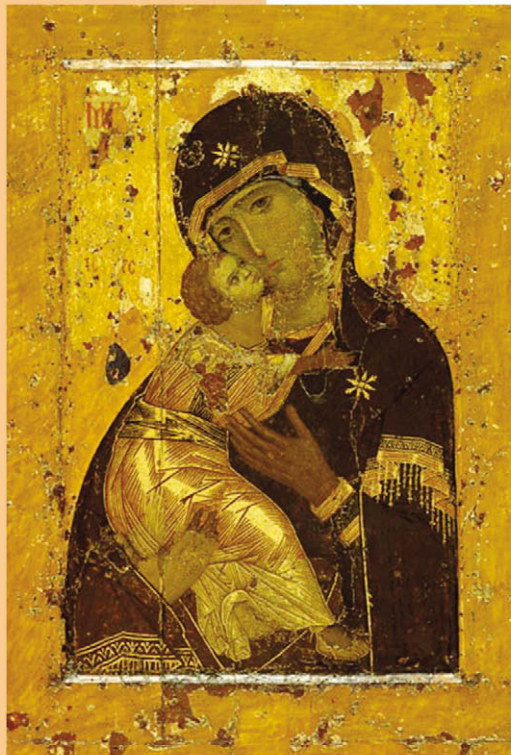
Божия Матерь Владимирская. XII в. Византия