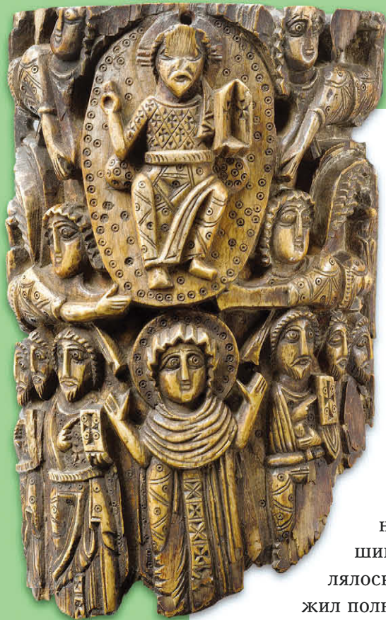
Вознесение Господне. VII в. Египет. Резьба по дереву