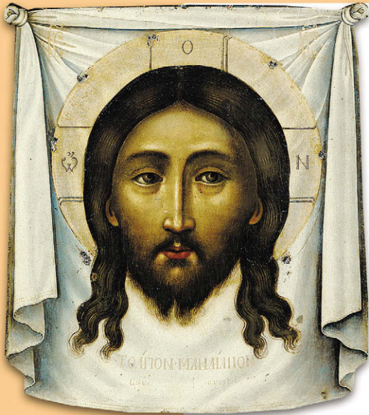
Симон Ушаков. Спас Нерукотворный. XVII в.