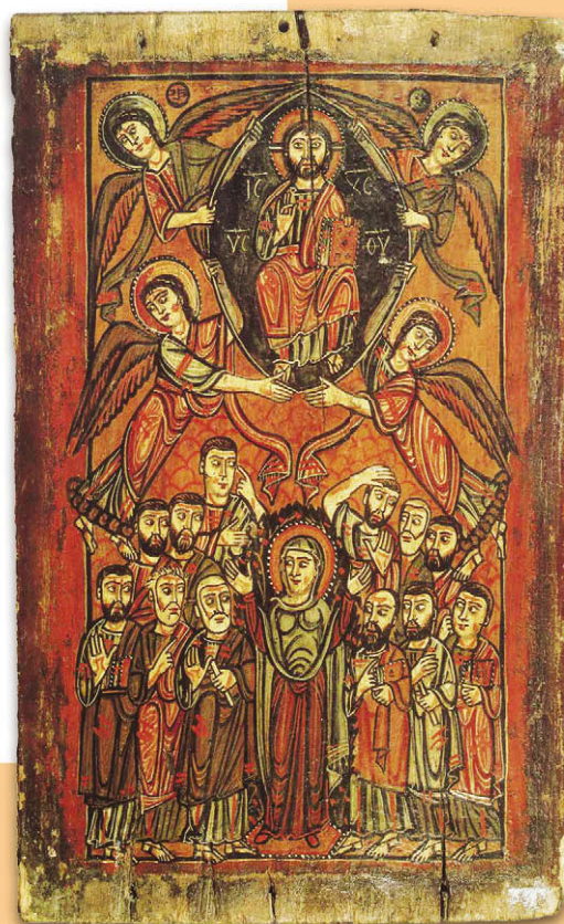
Вознесение. VIII—IX вв. Византия