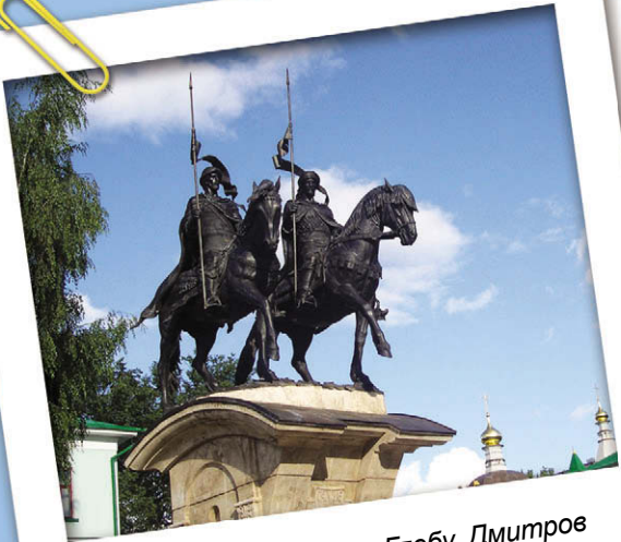
Памятник свв. Борису и Глебу. Дмитров