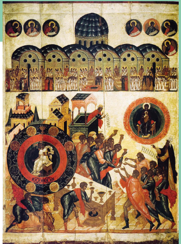
Премудрость созда себе дом. Икона. XVI в. Россия. Москва

Русская Православная Церковь установила особый день, праздник Всех святых, в земле Российской просиявших, который приходится на второе воскресенье после Троицы.