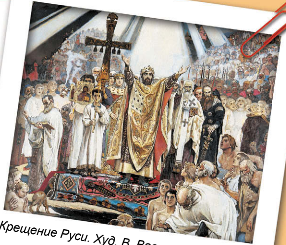
Крещение Руси. Худ. В. Васнецов

Крещение Владимира в 988 г. произошло в Херсонесе, византийском городе в Крыму. Владимир долго осаждал его и дал обет: креститься, если город будет взят его войсками. Херсонес пал, но Владимир не спешил с крещением. Он потребовал от византийских императоров Василия и Константина выдать за него замуж их сестру, царевну Анну. Те поставили условие: князь примет христианство. Он согласился. Царевна Анна прибыла в Херсонес. Владимира тем временем внезапно поразила тяжелая недуг: он ослеп. Анна послала к нему сказать: «Если хочешь избавиться от болезни, крестись поскорее». Князь крестился. И как только епископ возложил на него руку, тотчас Владимир прозрел.