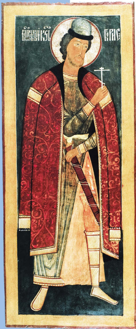
Благодарный князь-страстотерпец Борис. Икона. XVII в. Россия

Но коварный и властолюбивый Святополк не поверил искренности Бориса; стремясь оградить себя от возможного соперничества брата, на стороне которого были симпатии народа и войска, он подослал к нему убийц. Святой Борис был извещен о таком вероломстве Святополка, но