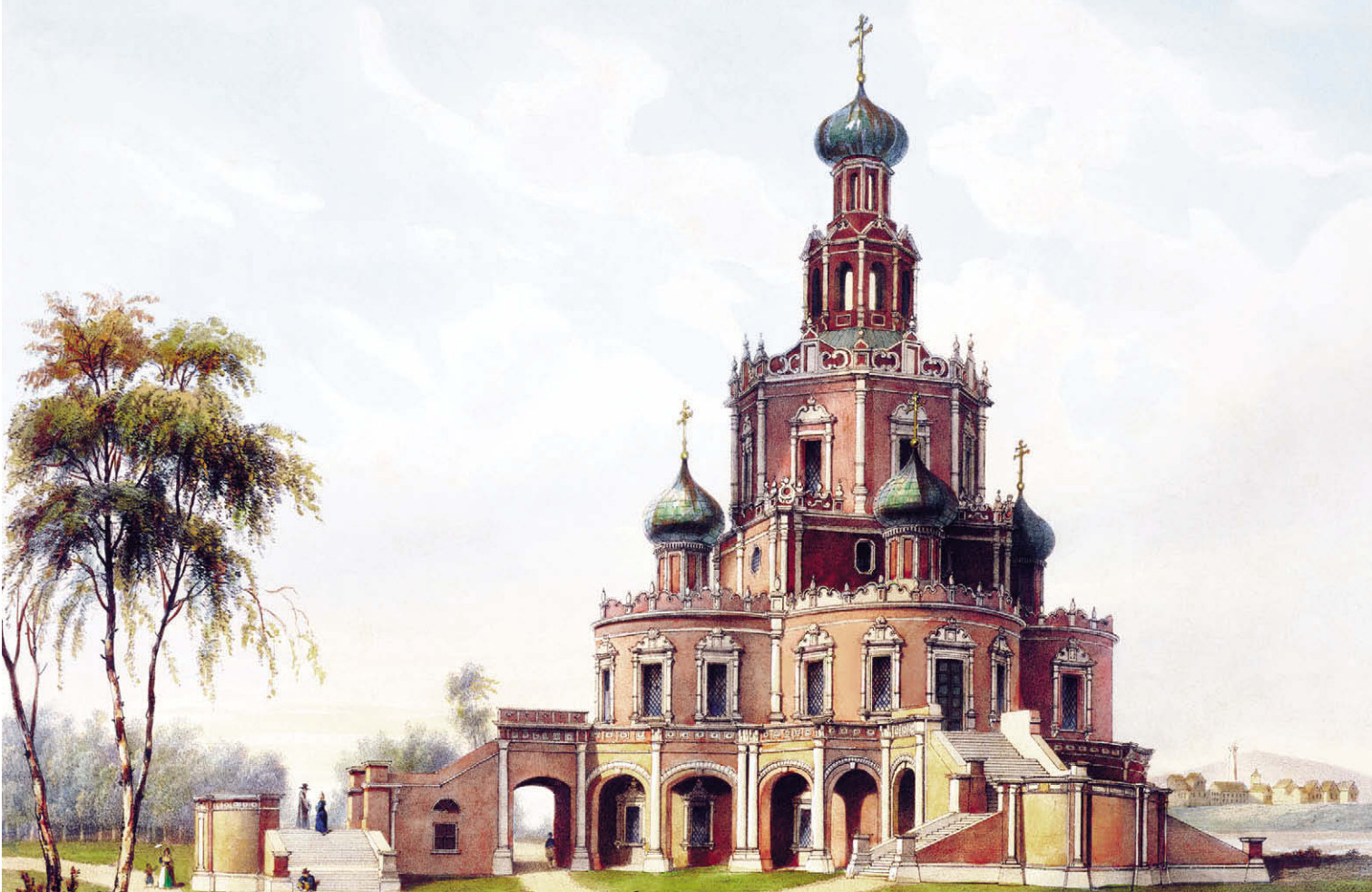
Церковь Покрова Пресвятой Богородицы Худ. Ж. Башелье

Вот мы идем в храм Божий на службу, приближаемся к нему. Еще издали слышен колокольный звон — мы слышим благовест. Это не просто «звонок на урок», созывающий народ в храм. Благовест — благая (добрая) весть — это проповедь, выплеснувшаяся на открытый простор, это призыв людей обратиться к Богу.