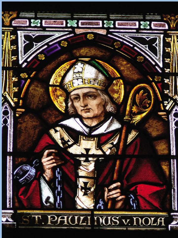
Павлин Ноландский Милостивый Витраж Худ. Вольфганг Саубер