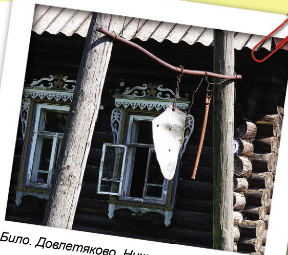
Било. Довлетяково, Нижегородская обл.

В целом на Руси била просуществовали довольно долго. Например, в Троице-Сергиевой Лавре било использовалось наряду с колоколом даже в середине XVII в. До сих пор била сохранились и используются в монастырях Греции и Болгарии.