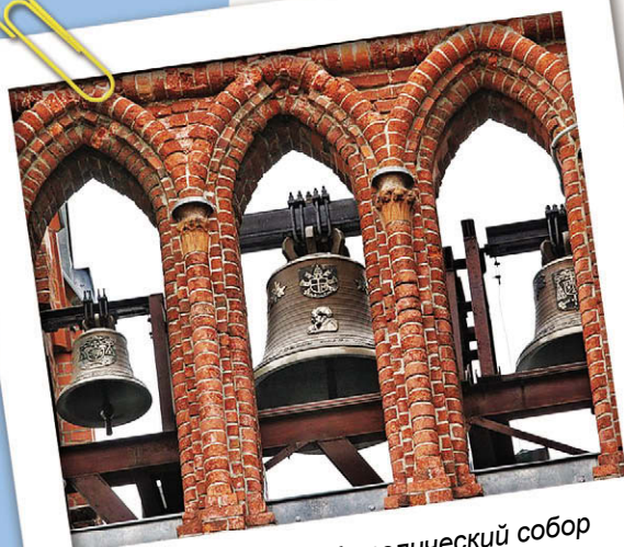
Очепные колокола. Католический собор Непорочного Зачатия Пресвятой Девы Марии в Москве

На Западе и в России используются разные способы звона. Язык нашего колокола — его важнейшая часть, так как звон производится с помощью ударов языком по куполу. На западе же, наоборот, звук образуется путем раскачивания корпуса колокола, который ударяется о язык. Пассивное положение языка по отношению к корпусу определяет и характер звучания, в котором слышатся скорее переливы без той мощи, на которую способен языко-