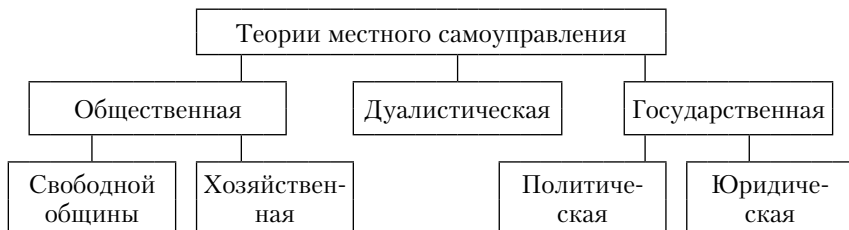
Рис. 2.1. Схематичное представление теорий местного самоуправления

Схематично все теории местного самоуправления представлены на рис. 2.1.