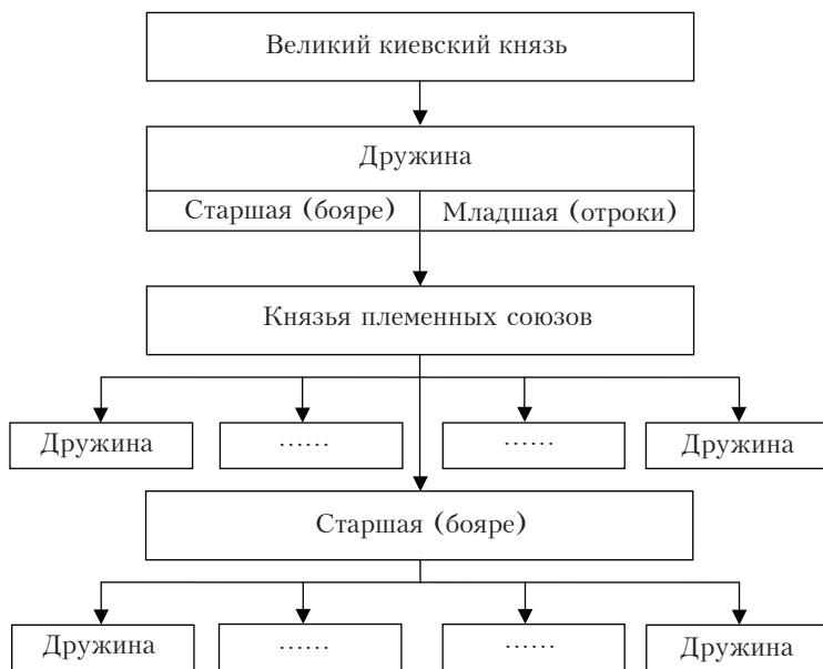
Схема 1. Система управления Древнерусским государством в X в.

разделилось на « княжих людей » — приближенных князя и « старцев градских » — потомков родоплеменной знати, хотя их социальное положение, судя по дошедшим до нас памятникам, весьма спорно. Низшим слоем дружинной организации была « молодшая дружина » (младшая дружина). Ее представителей называли отроками ; со второй половины XI в. так именовали преимущественно военных слуг князей и бояр, рекрутировавшихся в основном из « молодшей дружины », а для представителей менее зависимого от князей слоя внутри последней начинает употребляться термин детские , или гриди (схема 1).