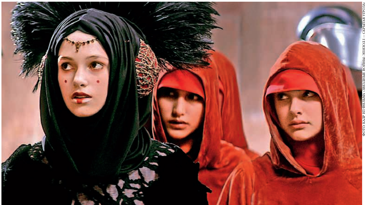
ФОТО: КАДР ИЗ ФИЛЬМА «ЗВЕЗДНЫЕ ВОЙНЫ: ЭПИЗОД I – СКРЫТЫЙ УГРОЗА»

попросту не смогла совмещать учебу с работой: съемки — то ли на беду, то ли к счастью — следовали одна за другой. «Пираты Карибского моря», «Реальная любовь», «Король Артур», «Пиджак», «Домино»... От бесконечных перевоплощений голова шла кругом. И очень трудно было остаться собой.