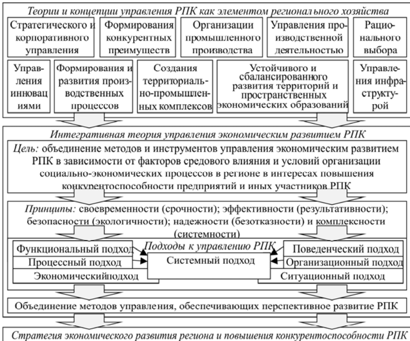
Рис. 2. Интегративная теория управления экономическим развитием РПК

Также в рамках изучаемых положений стратегического развития для отражения роли региональных промышленных комплексов представляет интерес определение в отношении макрорегиона Иншакова О.В. Он указывает, что в аспекте стратегического инновационного развития макрорегион можно представить как пространство, которое необходимо понимать и узнавать не с точки описания застывшей неизменной или «пустой» данности, а, прежде всего, как актуальный и реальный и, возможный и необходимый, случайно развивающийся и закономерно функционирующий, возобновляемый на всех уровнях, структурах и функциях процесс эволюции и системного воспроизводства специфических ресурсов, условий, факторов, а также продуктов конкретной изучаемой территории или области 1 .