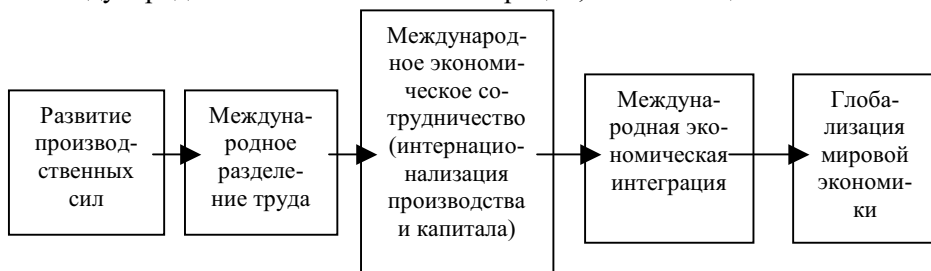
Рис. 1. Этапы интернационализации хозяйственной деятельности на пути к глобализации

Схематично процессы, ведущие к экономической интеграции и глобализации, можно упрощенно выразить взаимосвязанной цепочкой, представленной на рис. 1. В реальности сложно выделить эти этапы в чистом виде, можно выявить только определенные тенденции, и связи между ними. Эта схема приводится с целью иллюстрации таких явлений как интернационализация хозяйственной жизни, международное экономическое сотрудничество, международная экономическая интеграция, глобализация.