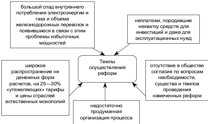
Рис. 2.1. Факторы, влияющие на осуществление реформ

Отсутствие конкурентной среды не было компенсировано контролем со стороны государства за обоснованностью издержек, инвестиционных вложений, структуры и уровней тарифов (цен) на продукцию и услуги естественных монополий.