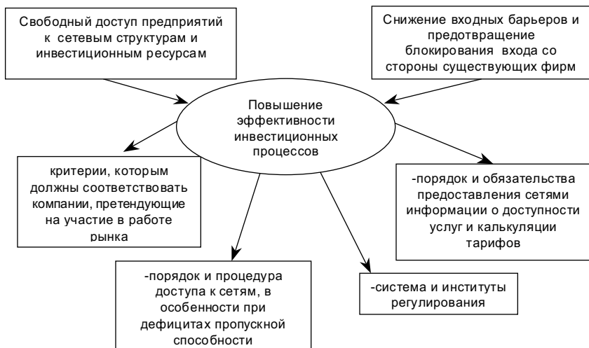
Рис. 1.3. Решение проблем организации конкуренции и повышение эффективности инвестиционных процессов

Конкретно для повышения эффективности инвестиционных процессов требуется решить ряд непростых вопросов (рис. 1.3).