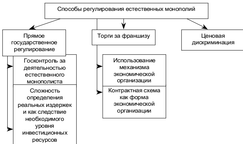
Рис. 1.2. Способы регулирования естественных монополий

При реализации данного подхода возникает сразу же несколько проблем (рис. 1.2) 1 .