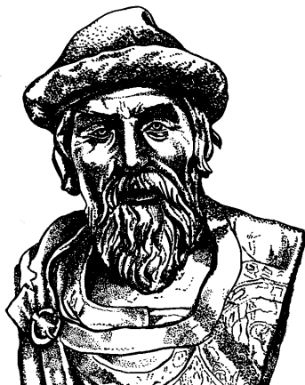
Внешний облик Ярослава Мудрого

Тенденция к разобщенности Киевской Руси обнаружилась после смерти Ярослава Мудрого. Во второй половине XI в. княжеские междоусобицы охватили Волынскую, Галицкую, Ростовскую, Суздальскую, Рязанскую, Тмутараканскую земли. Усилилась внешняя опасность со стороны половецких, польских, венгерских и др. правителей. В 1097 г. съезд русских князей в г. Любече принял решение о наследовании земель своих отцов и о независимости владений. Киевские князья Владимир II Мономах и его сын Мстислав, правившие с 1113 по 1132 г., пытались сохранить целостность государства, однако во 2-й четверти XII в. произошел окончательный распад Киевской Руси примерно на 15 фактически самостоятельных государств.