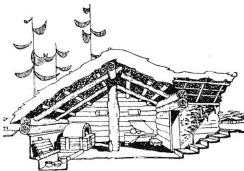
Жилище древних славян

Если наши предки жили в Восточной Европе, то их существование протекало в сложных условиях еще не устоявшегося после оледенения климата, поскольку гигантский ледник отступил с территории Северной Европы лишь около IV тыс. до н.э. Поэтому зима была суровой и спасать от холода могли только построенные жилища. Племена к тому времени еще не осели на земле, кочуя в поисках плодородных земель или спасаясь от вероятных врагов. Но уже началось разделение труда: скотоводство отделялось от земледелия, продолжали кочевать только племена охотников и рыболовов.