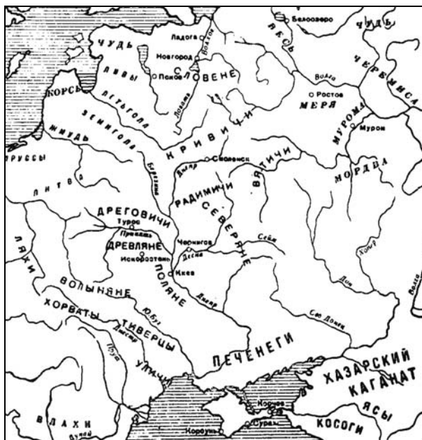
Карта расселения восточнославянских племен (по данным "Повести временных лет")

мери, муромы) дьяковской археологической культуры 14 . В бассейнах среднего и нижнего течения реки Оки, в Среднем Поволжье была распространена городецкая культура финноязычных племен, в бассейнах Камы, отчасти Средней Волги, Вятки и Белой – ананьинская культура.