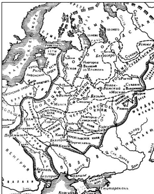
Схема русских княжеств в XII в. (по И.А. Голубцову)

разоряли отечество, жгли селения беззащитные, пленяли людей безоружных" 23 . Он высказал предположение, что "если бы Россия была единокорольным Государством (от пределов Днестра до Ливонии, Белого моря, Камы, Дона, Сулы), то она не уступила бы в могуществе никакой державе сего времени, спаслась бы, как вероятно, от ига Татарского, и находясь в тесных связях с Грециею, заимствуя художества ее, просвещение, не отстала бы от иных земель Европейских в гражданском образовании. Торговля внешняя, столь обширная, деятельная, и брачные союзы Рюрикова потомства с домами многих знаменитейших Государей Христианских – Императоров, Королей, Принцев Германии – делали наше отечество известным в отдаленных пределах Востока, Юга и Запада" 24 .