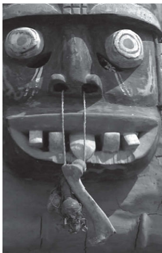
Илл. 10. Оскаленные, с выгаращенными глазами маски, призванные устрашать окружающих, известны во многих культурах. Кадр из фильма «Мужчина и женщина» (The Human Sexes, 1997).

представители всех культур. Распознать такой враждебный взгляд легко по суженным зрачкам.