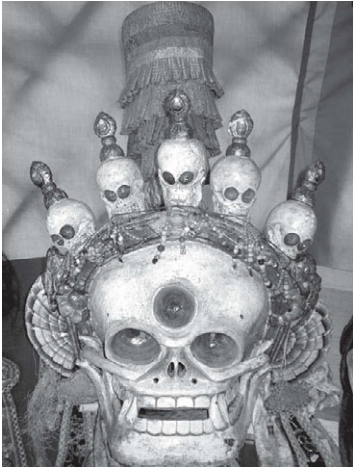
Илл. 9. Мимика оскала используется у разных народов в скульптурах и мелкой пластике для отпугивания и устрашения злых духов. Ритуальная маска церемонии Цам. Монголия (2006 г.).

с «мимическим каноном», характерным для данной культуры.