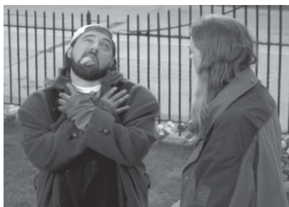
Илл. 4. Высунутый язык в сочетании с заведенными вверх или полуприкрытыми глазами используется как простой и лаконичный знак смерти. Кадр из фильма «Догма» (Dogma, 1999).

В заветной сказке из сборника А. Н. Афанасьева похотливая барыня покупает у мужика два мужских члена, которые начинают действовать после слов: «Но-но!» Но, приказав им «работать», барыня вдруг понимает, что хитрый торговец не сказал, как их остановить, и срочно посылает прислугу узнать этот секрет. «Прибежала горничная и видит: барыня уж без памяти и язык высунула; вот она сама крикнула на них: «Тпру!» Оба х... сейчас вы-