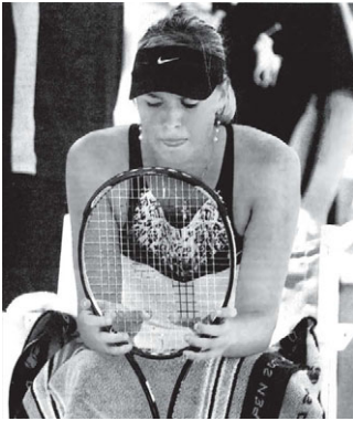
Илл. 2. Высунутый язык является маркером внутреннего напряжения, волнения или стресса. Мария Шарапова после поражения на Открытом чемпионате США (Известия. 2007. № 158. С. 11. Фото «AFP»).

сильных эмоций, как высовывание языка, манифестирует временный возврат индивида в состояние детства или даже в дочеловеческую, «животную» стадию.