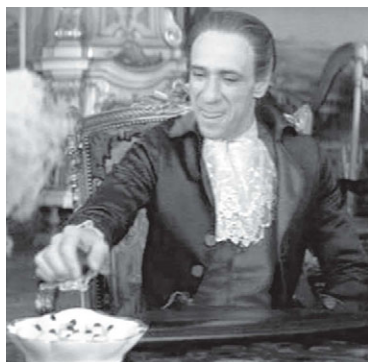
Илл. 7. Мимика желания, предвкушения имеет общую морфологию как у людей, так и у животных. Кадр из фильма «Амадей» («Amadeus», 1984).

Поскольку желание может распространяться и на другие физиологические «естественные» потребности и процессы, начиная с испражнения, заканчивая сексом, то не удивительно, что аналогичная мимика и жестикаляция сопутствует всем этим внешне и филогенетически очень разным явлениям. Как отмечает В. А. Пронников, «в сексуальных играх (...) язык не просто высовывается, он совершает движения в поисках какого-то объекта. Именно такие движения языком наблюдаются при страстных поцелуях» (Пронников, Ладанов, 2001, с. 31, 32).