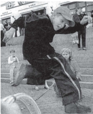
Илл. 3. В этом случае высунутый язык свидетельствует об усталости или чрезмерных усилиях. (Известия. 2005. № 190. С. 12. Фото С. Каптикалина).

Сильное напряжение, усталость; знак агонии, смерти. Еще одним психофизиологическим фактором, обуславливающим появление данного жеста, является сильное напряжение и усталость в результате