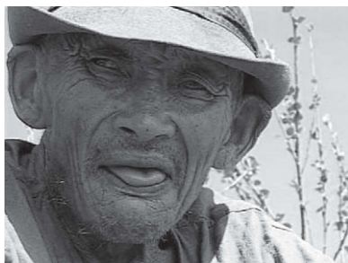
Илл. 8. С. 46—02: В данном случае высунутый язык является признаком старческой немощи, дряхлости. Кадр из фильма «Нганасаны».

Рассмотрим отдельные мимические выражения, часто сопутствующие высовыванию языка, и их смысловую нагрузку. Внешнее проявление эмоций осуществляется посредством специфических выразительных движений, являющихся результатом мышечной активности. Хотя эмоции и представляют собой субъективные переживания, исследования показывают, что их можно классифицировать и объединить в такие основные категории как гнев (злость), страх, грусть, радость, удивление, отвращение. Эти категории внешне проявляются сходным образом у людей из разных культур. Как мы убедимся ниже, мимика представителей разных культур во многом близка, хотя степень ее проявления на лице может видоизменяться в соответствии