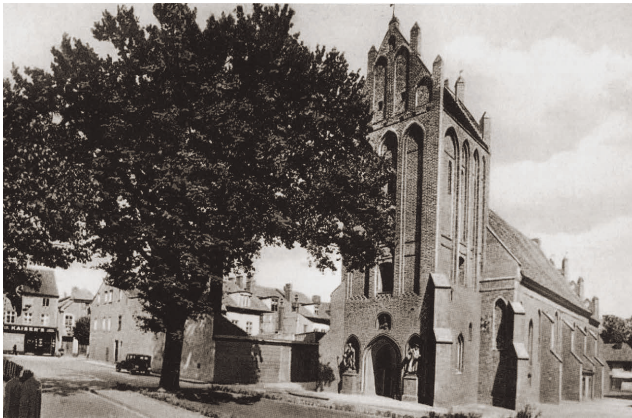
▲ Епископская церковь Святого Адальберта в Фишхаузене. Построена в 1305—1315 годах

Воины в племенах объединялись в дружины. В свою очередь дружины разных племен создавали дружинно-племенной союз, чтобы защищаться от внешнего врага. Они смогли сосуществовать с викингами, когда те пришли на их берега. Более того, викинги, если верить заключениям ученых, даже входили