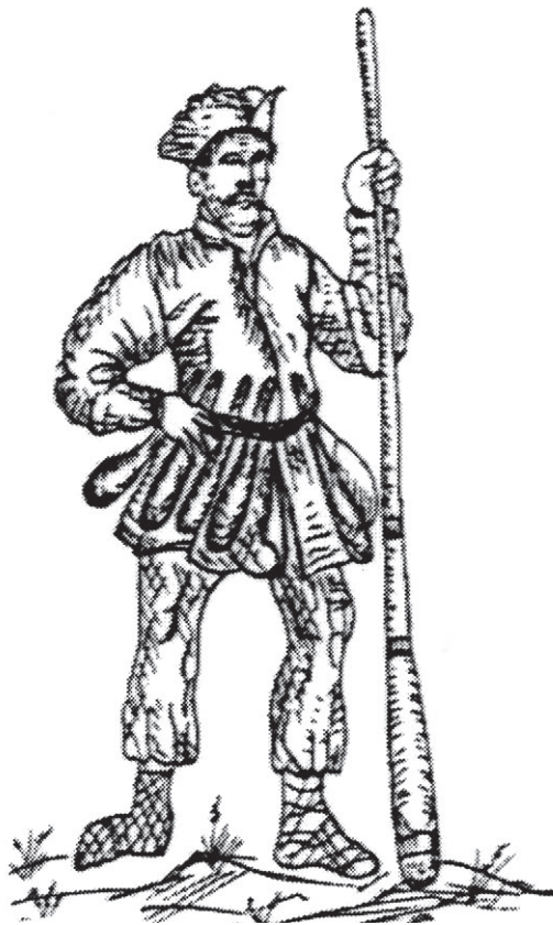
▲ Вооруженный язычник-прусс

Сами пруссы никогда себя не называли «пруссами». Так их называли другие, и по сути, это было имя собирательное для обозначения многоплеменного союза. О пруссах упоминают в X веке арабские источники, «прописались» «проуси» и в берестяных грамотах Руси. Одни современные ученые предполагают, что название «пруссы» связано с древнеиндийским «purusch», то есть «человек». Другие истолковывают слово «прусас» как «орошенный кровью». В этом, последнем, — отзвук бурь тысячелетий: не была спокойной земля у моря. Век за веком одни народы на берегах Балтики сменяли другие, племена перемещались с места на место, смешивались друг с другом, какие-то из них оставались на исторической сцене, а какие-то уходили навсегда, как это случилось с самими пруссами.