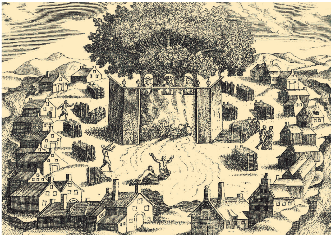
▲ Изображение прусского святилища Ромове в книге К. Харткноха «Старая и новая Пруссия», 1684 год

ли в состав прусских дружин. На северной окраине нынешнего Гурьевска археологи обнаружили захоронение знатного воина с двумя соратниками в виде каменной ладьи, что характерно для Южной Скандинавии.