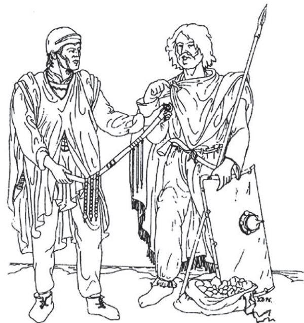
▲ Романизированные эстии

Адам Бременский так писал в 1075 году: «Зембы, или пруссы, самый гуманный народ. Они всегда помогают тем, кто попадает в беду в море или на кого нападают разбойники. Они считают высшей ценностью золото и серебро... Много достойных слов можно сказать об этом народе и их моральных устоях, если бы только они верили в Господа, посланников которого они зверски истребляли. Погибший от их рук Адальберт, блистательный епископ Богемии, был признан мучеником. Хотя они во всем остальном схожи с нашим собственным народом, они препятствовали, вплоть до сегодняшнего дня, доступу к своим рощам и источникам, полагая, что они могут быть осквернены христианами».