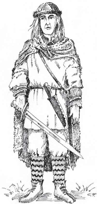
▲ Реконструкция внешнего облика мужчины-курша

Раскопки в Кораллен-Берге на Куршской косе недалеко от нынешнего поселка Рыбачьего дали повод ученому, доктору исторических наук В. И. Кулакову говорить о том, что «...постепенно викинги смешались с куршами и в конечном счете составили костяк местного населения; его через два столетия и застали крестоносцы». Местные жители и в XIX веке вспоминали, что когда-то на дюнах жили в хижинах Кораллен-Берга шведские рыбаки.