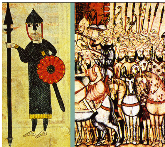
Рис. 20.4. Воин-вестгот (слева) и мусульманские всадники: средневековые миниатюры (Chronik: 223, 283)

Впервые католики столкнулись напрямую с воинами Мухаммеда в июле 710 года. Тогда берберский вольноотпущенник и исламский неопит Абу Зур'а Тариф с пятью сотнями воинов пересек Гибралтар и вскоре вернулся с богатой добычей. Кстати, высадился он там, где на крайнем юге Испании и донныне расположен небольшой город его имени — Тарифа. И еще один связанный с этим событием любопытный сюжет: воинов Тарифа перевозили на кораблях византийского наместника и православного — «греческой веры» — (графа) Юлиана, что управлял этими крайне удаленными от Константинополя землями на северо-западном мысу Африканского континента. Судя по всему, Юлиану не тер-