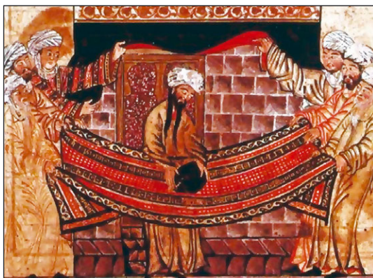
Рис. 20.1. Пророк Мухаммед поднимает с покрывала святыню святынь Черный Камень, чтобы вставить ее в восточную стену Каабы (Chronik: 237; Миниатюра из Рашид-аль-Дин Хамадани, Джами аль-таварих, с.1315)