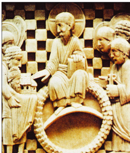
Рис. 21.1. Оттон I — родоначальник Священной Римской империи и строитель Магдебургского собора — принимает благословение от Христа-Вседержителя. Пластина из слоновой кости. Около 970 г. (Панорама: 298)