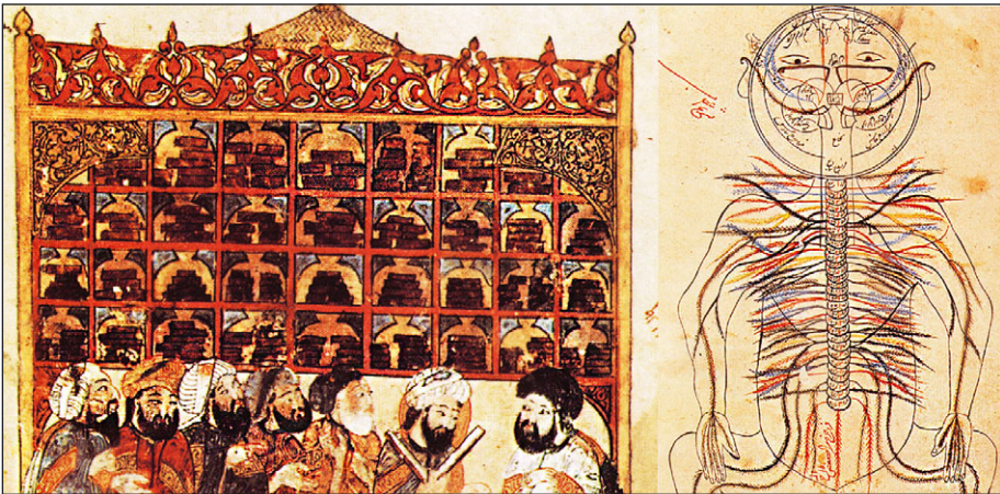
Рис. 21.4. Книжки, стопками разложенные по полкам в библиотеке Багдада (13 век, Аль-Харири «Макамат»); под ними беседующие на важные темы мусульманские ученые. Справа: рисунок со схемой нервной деятельности в книге «Канон врачебной науки» Авиценны, начало 11 века (Панорама: 240)

Пожалуй, особая забота была связана с выработкой арабской письменности на базе финикийского (сирийского) алфавита. Это было крайне необходимо для канонизации изречений пророка в сурах Корана. Параллельно вырабатывалась знаковая система арабских цифр, оказавшаяся чрезвычайно пригодной для записи чисел в десятичной системе счисления.