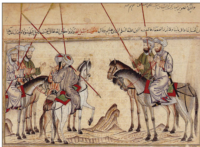
Рис. 20.2. Битва при Бадре: Миниатюра из Рашид-аль-Дин Хамадани, Джамии аль-таварих (Wikipedia)