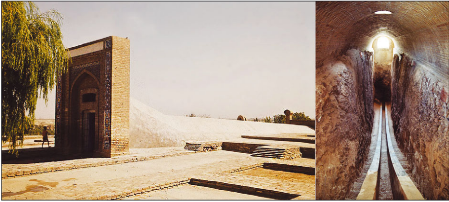
Рис. 21.3. Знаменитая обсерватория Улугбека, внука Тамерлана, построенная в Самарканде в 1428 году. Справа: сохранившаяся часть подземного квадранта обсерватории