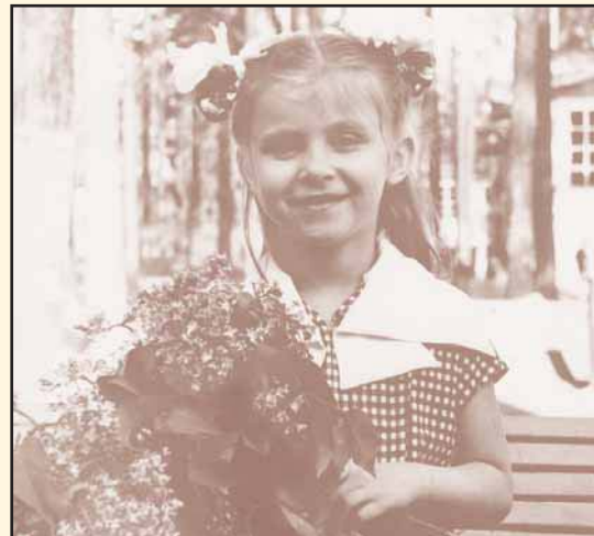
День рождения, 6 лет