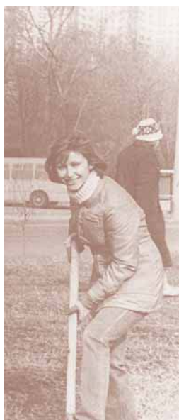
Коммунистический субботник. 1986

Я и мои коллеги, которые со мной перешли на работу в журнал, не прогадали. Денег не было, зарплаты выплачивались мизерные, но мы выкарабкались, правильно расставив финансовые приоритеты. Для этого приходилось сильно рисковать: деньги в то время обесценивались, и я решила покупать ценные бумаги, которые в итоге дали нам необходимую финансовую подпитку. После очередной «авантюры» с ценными бумагами мы за три месяца удвоили капитал, купили на него