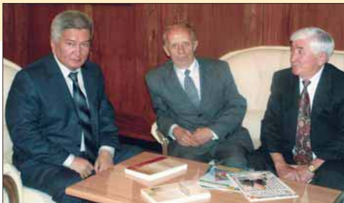
На приеме у премьер-министра Киргизии Ф. Кулова. 2005