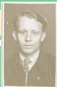
Славные годы студенческие. 1955—1959

В СТУДЕНЧЕСКИЕ ГОДЫ Я БЫЛ ПОСТОЯННЫМ ПОСЕТИТЕЛЕМ ГАЛЕРОК ТЕАТРОВ И КОНЦЕРТНЫХ ЗАЛОВ