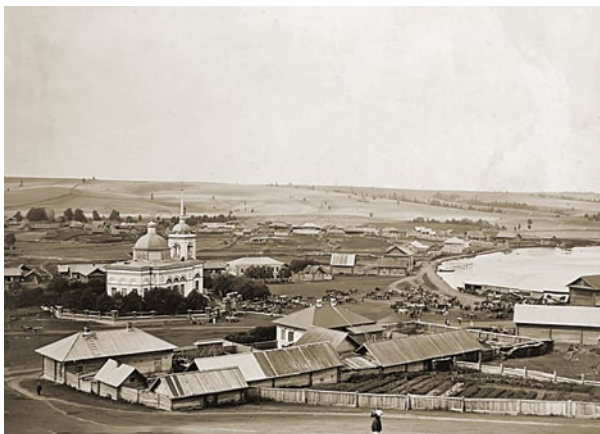
Часть Федоровского винокуренного завода, нач. XX в.