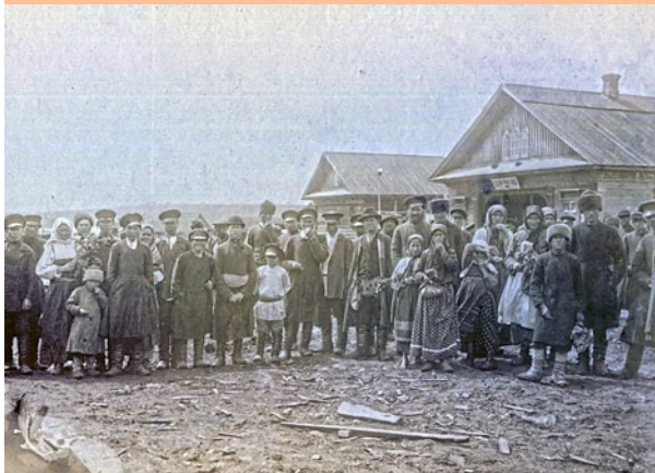
Жители с. Верх-Буй, начало XX в.