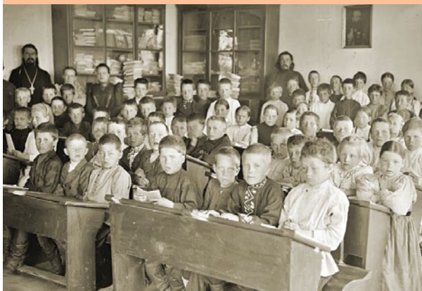
Ученики земской школы при Федоровском заводе Осинского уезда, нач. XX в.