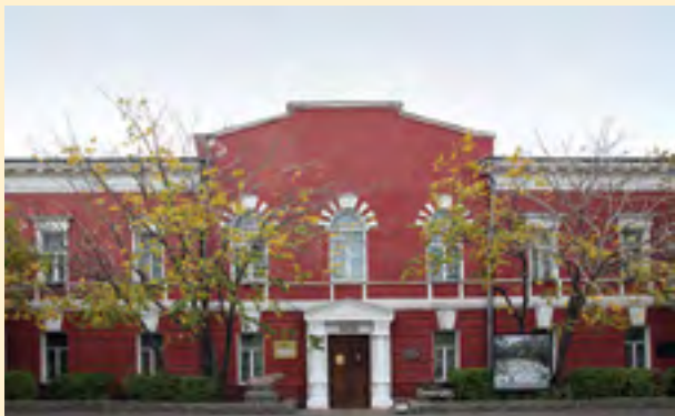
Алтайский государственный краеведческий музей ул. Ползунова, 46 ☎ 63-47-58