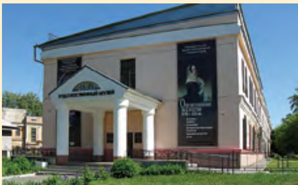
Государственный художественный музей Алтайского края пр. Ленина, 88 ☎ 61-25-10

Один из старейших в России. Основан в 1823 г. Музейное собрание насчитывает более 150 тыс. экспонатов, среди которых единственная в России модель паровой машины, изобретенная в Барнауле И. И. Ползуновым в 1763 г. В музее можно узнать об истории Алтая, начиная с каменного века и до современности.