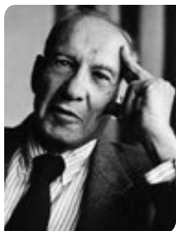
Питер ДРУКЕР (1909—2005), выдающийся американский экономист

В новой экономике, сложившейся к концу XX века, интеллектуальные работники представляют собой рабочую силу, в качественном отношении разительно отличающуюся от пролетариата, традиционно считавшегося основным поставщиком материальных ценностей. Это правда, что интеллектуальные работники составляют меньшинство в общей структуре рабочих сил, и соотношение это вряд ли когда-либо изменится в противоположную сторону. Но они уже стали основными производителями материальных ценностей. Все больше успех в бизнесе (и даже его выживание) будет зависеть от того, насколько эффективно будет трудиться эта группа сотрудников. А поскольку, согласно законам статистики, единственный способ выживания для компании интеллектуальной эры — заполучить «лучших людей», то для дальнейшего развития чрезвычайно важно повысить эффективность и продуктивность их труда за счет правильного управления их интеллектуальным потенциалом. Перефразируя старую поговорку — заставить обычных людей создавать необычные вещи.