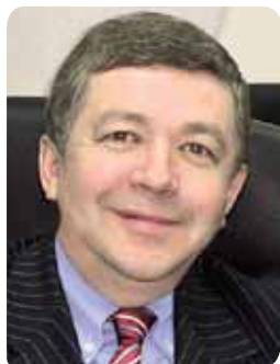
Руслан ГРИНБЕРГ, академик РАН, директор института экономики РАН

Модернизация остается в повестке дня, поэтому необходимо разглядеть все подводные камни на пути ее осуществления. Налицо пассивность институтов инновационного развития. Необходимо более мощное и менее робкое венчурное финансирование. У нас боятся тратить деньги, на инновации их реально тратят совсем не в рамках венчурного финансирования. Очень важно, чтобы действовали особые экономические зоны, такие, в частности, как в Елабуге. Необходимо создать стимулы для долговременных инвестиций, причем в большом количестве «точек». Для этого нужны не только федеральные, но и региональные банки развития.