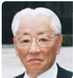
Акио МОРИТА, основатель компании Sony

Однажды в субботу мы проводили в Токио совещание руководителей отделов, и кто-то спросил меня что случилось с нашим лозунгом «Исследования решают все». Почему в последнее время его не видно в наших рекламных объявлениях?