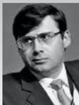
Сергей ШВЕЦОВ, заместитель председателя ЦБ РФ:

— Банк России рекомендует системно значимым банкам выплачивать не менее половины бонусов топ-менеджерам в зависимости от динамики стоимости акций этих банков. Такие рекомендации правительство ранее дало системно значимым компаниям, и мы считаем, что эти правила можно применить и в отношении банков.