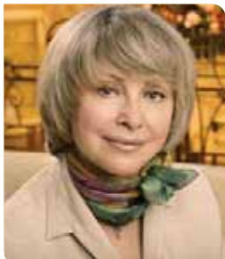
Фото: Федор Симмуль