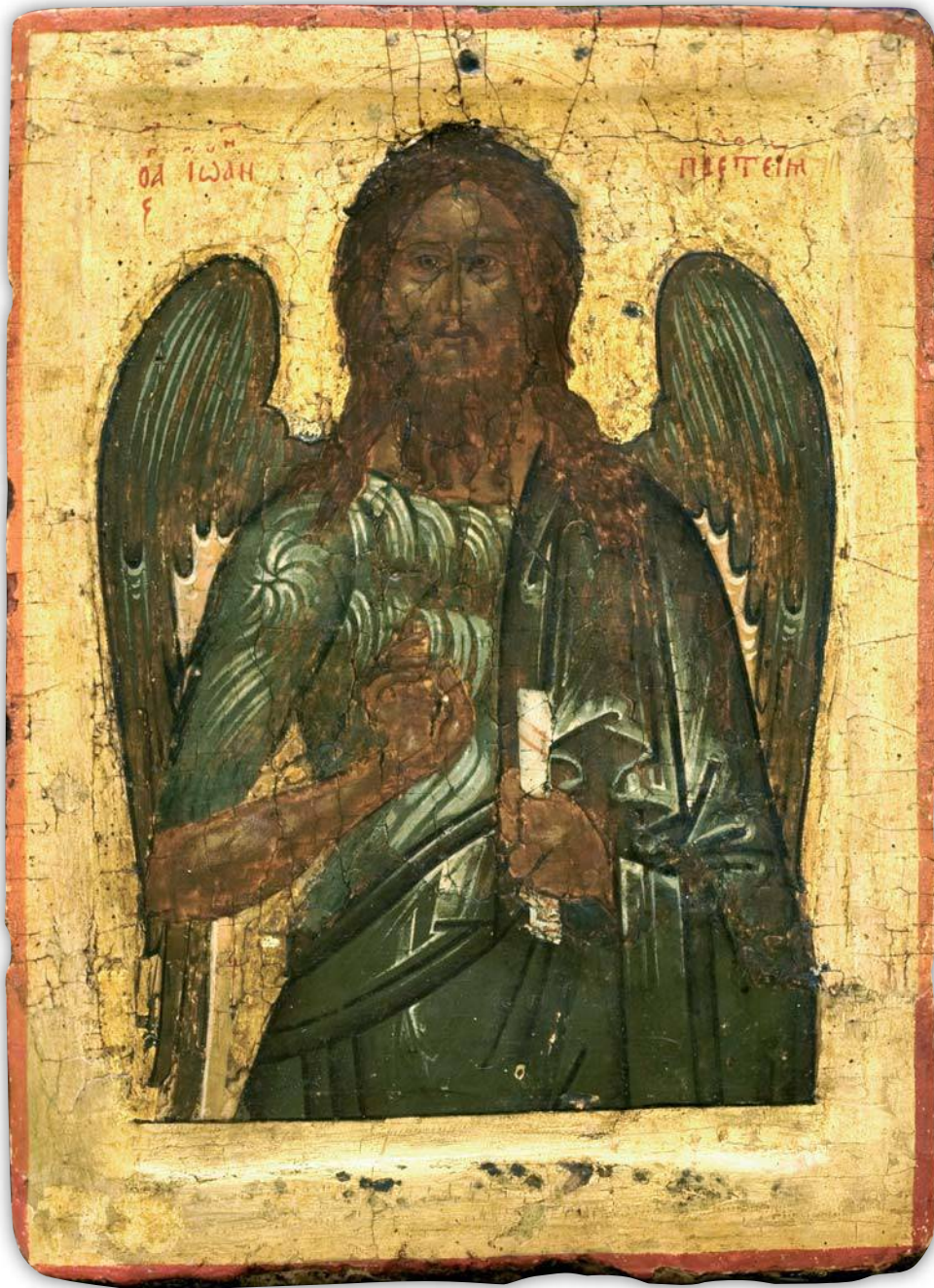
Кат. 6. Иоанн Предтеча Вторая четверть – середина XVI века. Средняя Русь