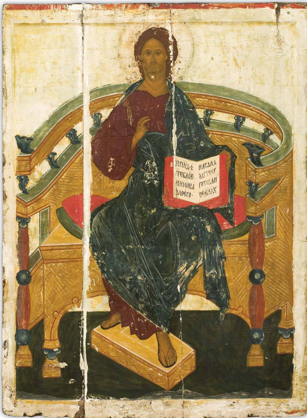
Кат. 5. Господь Вседержитель на престоле Первая половина XVI века. Новгород (в процессе реставрации)