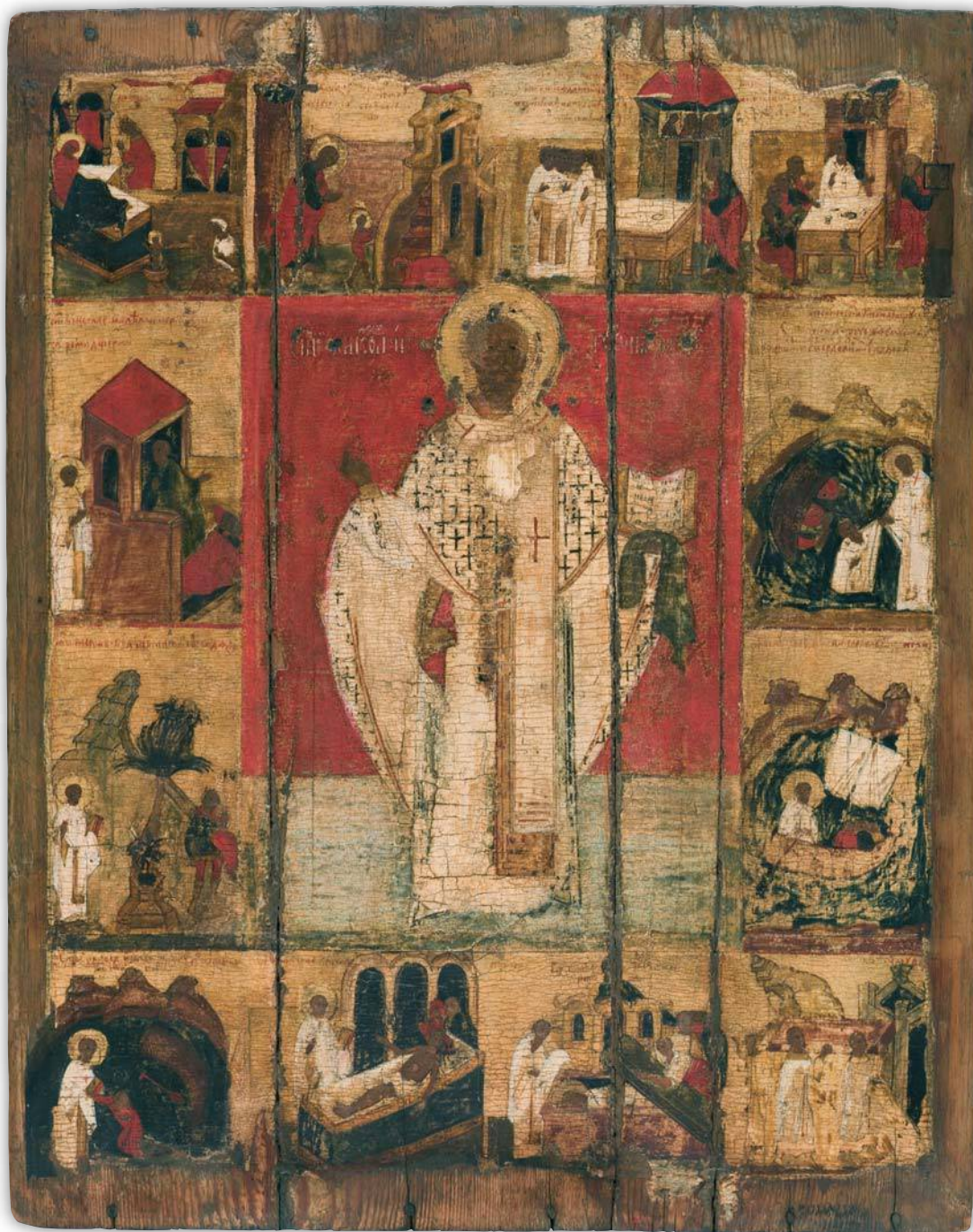
Кат. 2. Святитель Николай Чудотворец, с житием Середина – вторая половина XV века. Средняя Русь