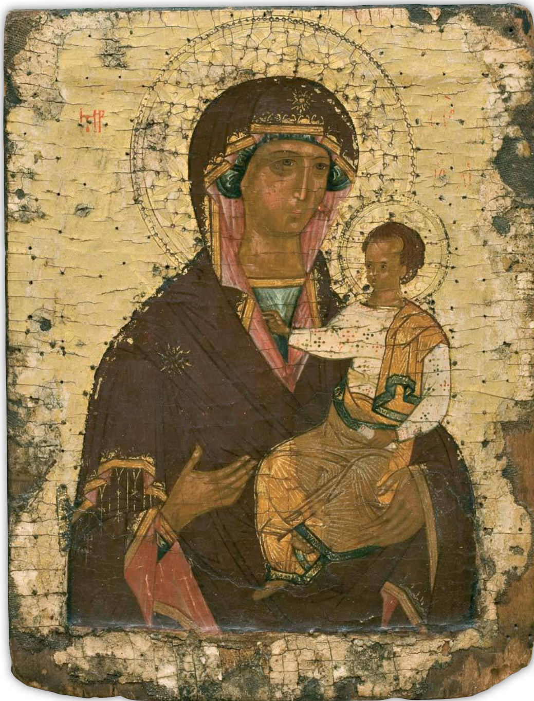
Кат. 3. Богоматерь Седмиезерная Конец XV века. Ростов (?)