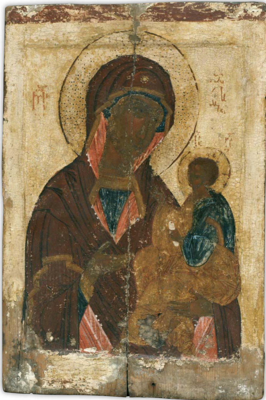
Кат. 1. Богоматерь Одигитрия (типа Грузинской) Первая половина XV века. Новгород