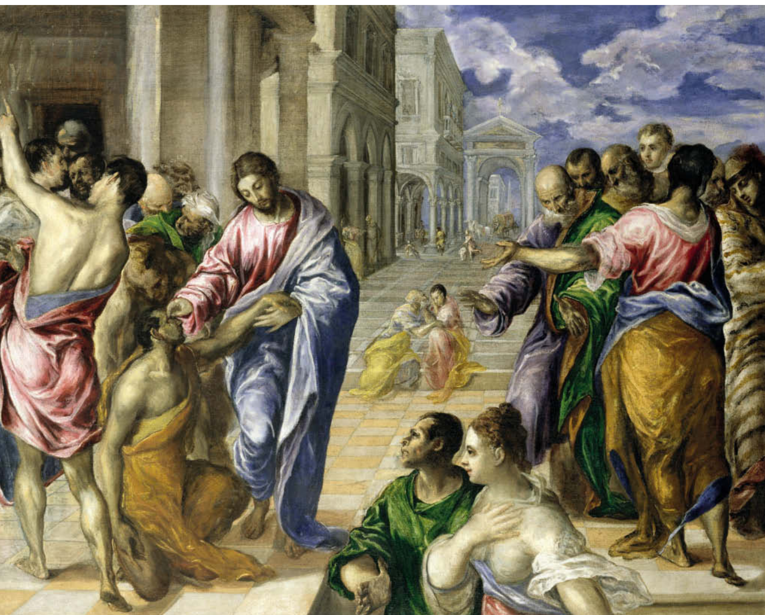
«Исцеление слепого», 1567–1570, дерево, масло. Национальная галерея, Парма

искусства. Картины Эль Греко отличались оригинальной экспрессивностью и небывалой драматичностью, благодаря которым его полотна приближаются к работам современных живописцев, однако в свое время талант его не снискал признания. Современники не понимали его работ, ведь они так сильно отличались от общепринятых в то время кано-