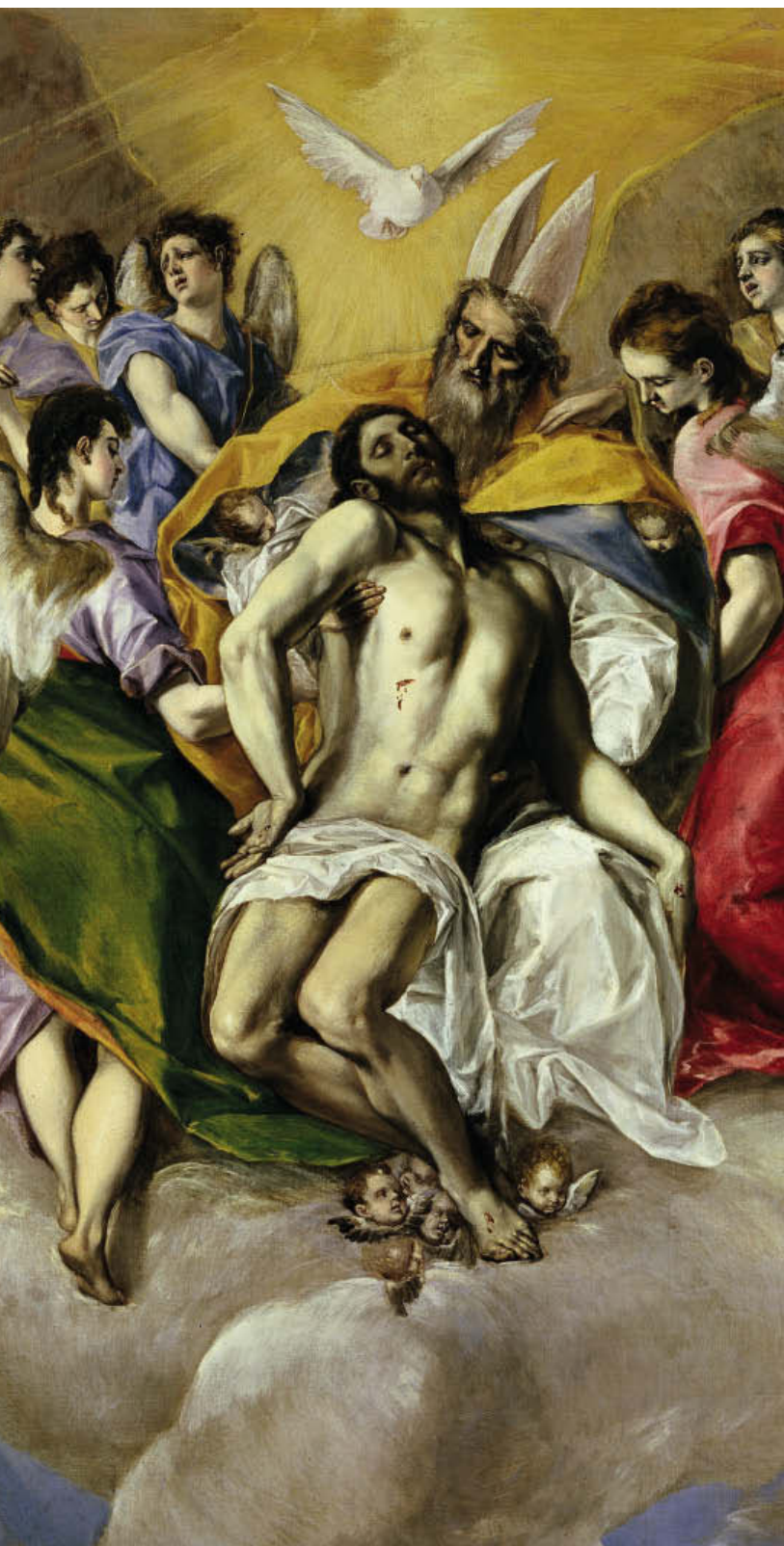
«Святая Троица», 1577, холст, масло. Национальный музей Прадо, Мадрид

нов. Возможно, именно потому, что современники мало интересовались Эль Греко, до наших дней дошло так мало документов, по которым мы могли бы восстановить жизненный путь мастера, а его работы получили признание лишь спустя сотни лет после смерти художника.