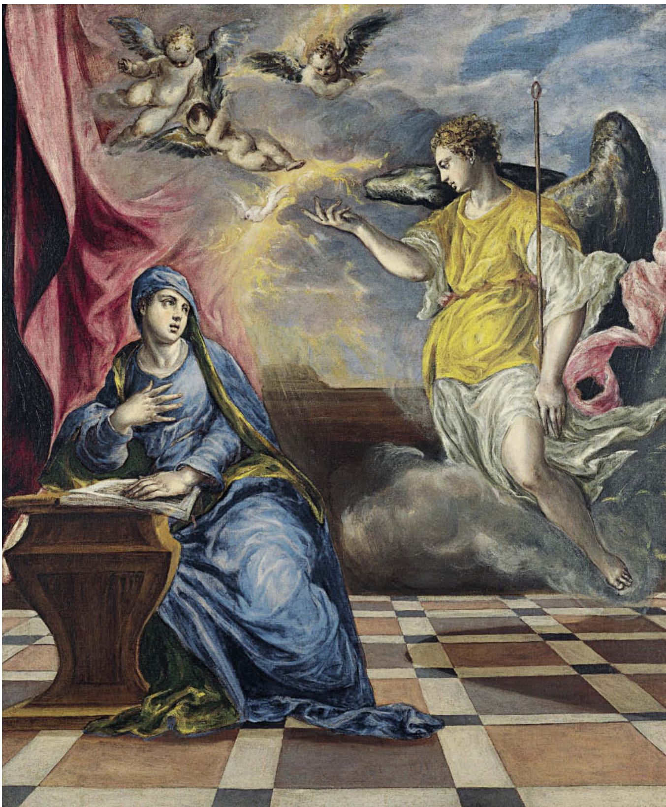
«Благовещение», 1576, холст, масло. Музей Тиссена-Борнемисы, Мадрид