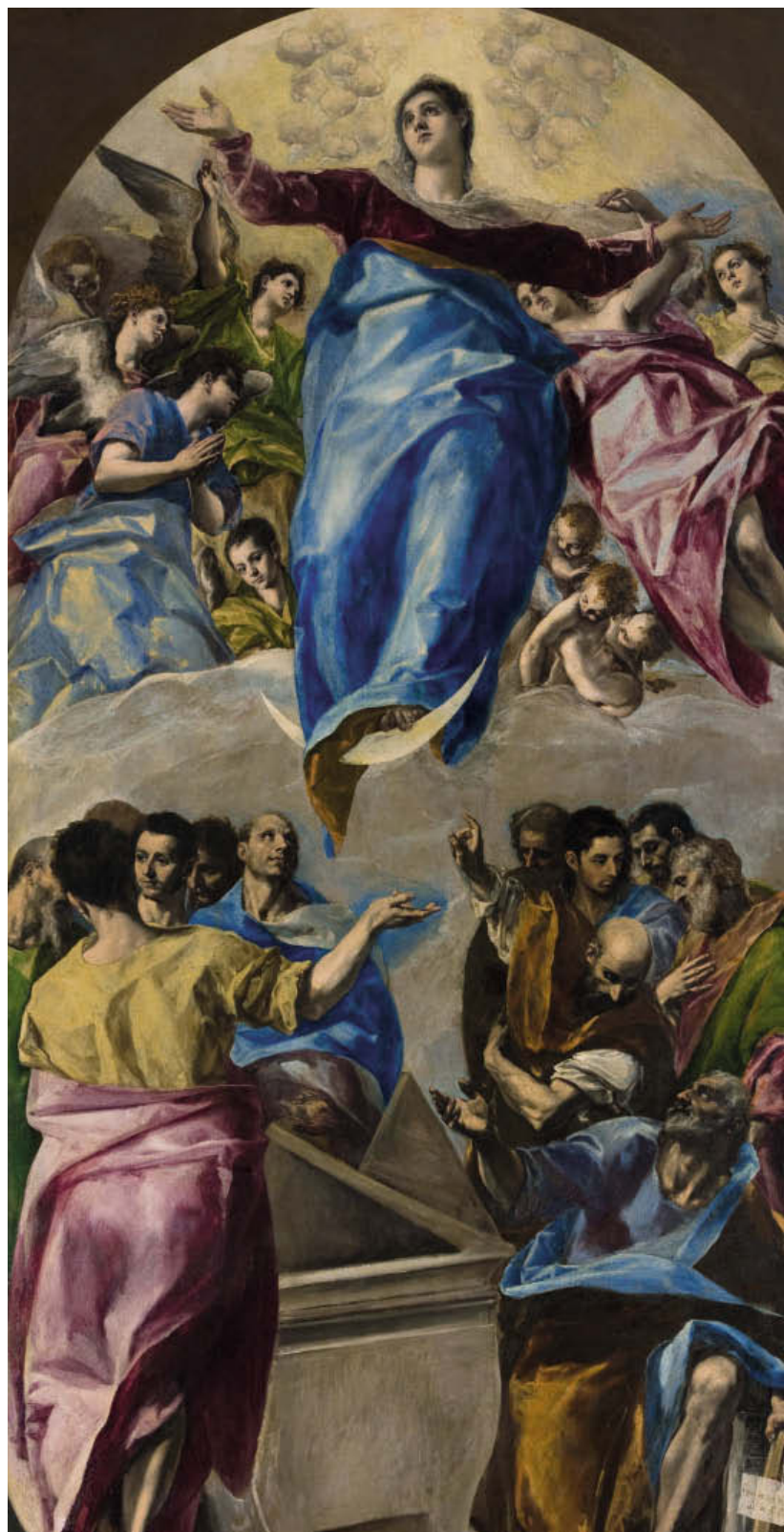
«Успение Богородицы», 1577, панель, масло. Чикагский институт искусств, Чикаго

Учиться живописи Эль Греко начал в критской живописной школе, где изучал иконопись (в то время критские иконы славились по всей Европе). Интеллектуальная и артистиче-