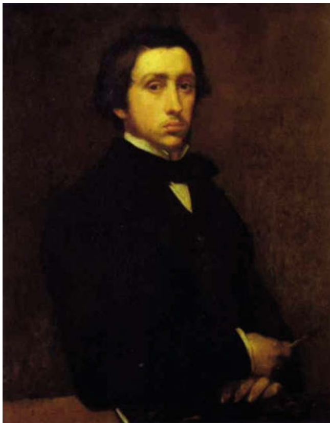
«Автопортрет», 1855, холст, масло. Музей д'Орсэ, Париж

Замечательные картины, рисунки Дега, высочайшее мастерство, достигнутое им в передаче движения, — все это обеспечивает его принадлежность к плеяде великих художников, оказавших наибольшее влияние на дальнейшее развитие мировой живописи. Во всех его работах, столь разных по настроению и содержанию, есть некие общие приметы, и самая важная из них — его извечное увлечение состоянием равновесия. Танцовщица это или жокей на коне, циркач или просто натурщик, Дега, вписывая фигуры в окружающее пространство, всегда стремился достичь равновесия. Интерес к вопросам притяжения человека к земле является отличительной чертой его произведений.