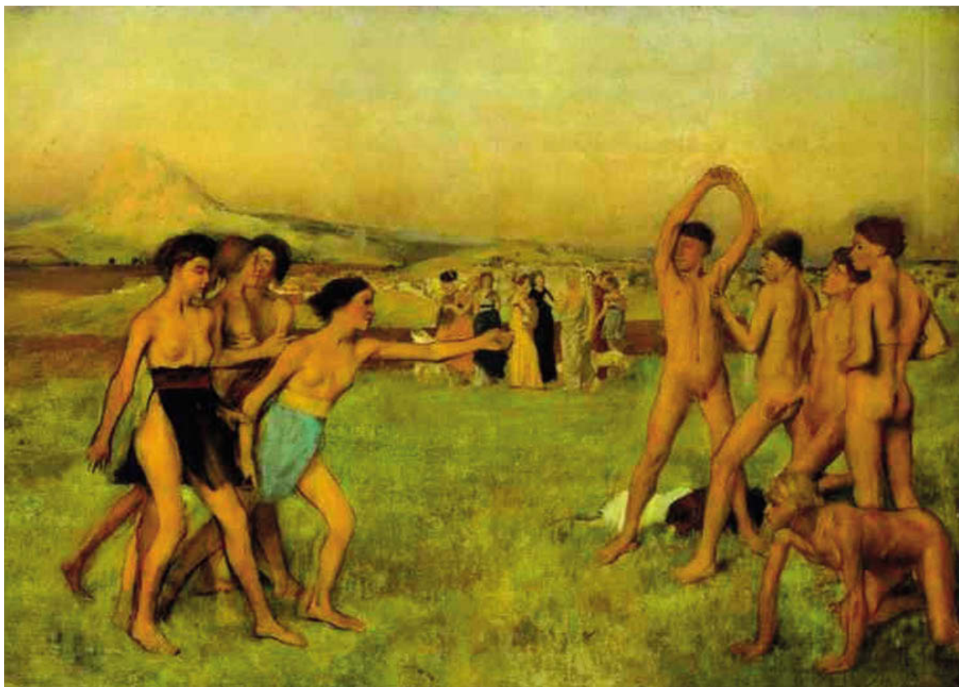
«Юные спартанцы», 1860, холст, масло. Лондонская Национальная галерея, Лондон

короткой встречи с Энгром старый мастер посоветовал: «Рисуйте линии, молодой человек, множество линий, и вы станете хорошим художником». Когда в 1856 году Дега отправился в Неаполь, он, несмотря на свой юный возраст, был уже основательно подготовлен. Это было традиционное посещение Италии, которое предпринимали почти все французские художники.