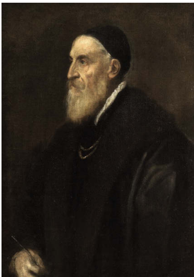
«Автопортрет», около 1567, холст, масло. Национальный музей Прадо, Мадрид

Тициана, которого современники называли королем живописцев и живописцем королей, смело можно поставить в один ряд с такими титанами Возрождения, как Микеланджело, Леонардо да Винчи и Рафаэль. Будучи настоящим мастером своего дела и поистине разносторонним человеком, Тициан, всеми признанный автор картин на библейские и мифологические сюжеты, прославился еще и как блестящий портретист. А его открытия в области живописи и по сей день считаются бесценными. Среди заказчиков художника были короли и римские папы, кардиналы и герцоги.