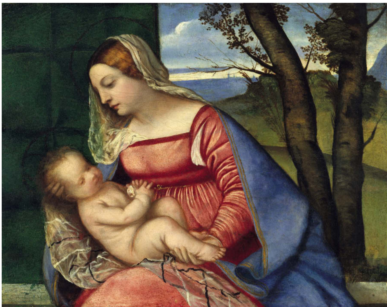
«Мадонна с Младенцем», 1510, холст, масло. Метрополитен-музей, Нью-Йорк

Но это утверждение, скорее всего, имеет мало общего с действительностью. Многие современники живописца указывали на период с 1473-го по 1482-й год. В последнее время специалисты склонны считать годом рождения художника 1490 год. А вот ученые, работающие в Метрополитен-музее и Исследовательском институте Гетти, придерживаются иной версии — они полагают, что Тициан появился на свет в 1488 году.