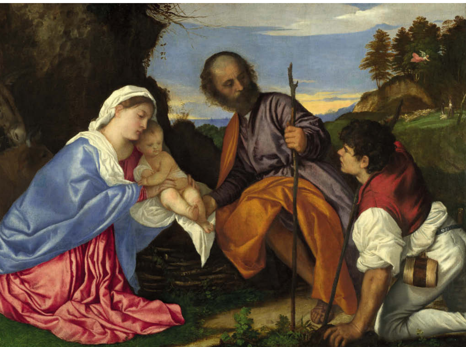
«Святое семейство с пастырем», 1510, холст, масло. Лондонская Национальная галерея, Лондон

начал учиться и работать в мастерской Себастьяно Цуккато, откуда потом перешел в мастерскую Джентиле Беллини, а затем к Джованни Беллини. Во время обучения Тициан познакомился со многими видными представителями венецианской живописной школы. Но самые тесные отношения у него сложились с Джорджоне (Джорджо Барбарелли