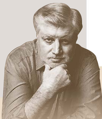
С.М. Миронов — Председатель Совета Федерации Федерального Собрания РФ

Провозглашение 2011 года Международным годом химии является свидетельством высокого общественного признания значения достижений химии для обеспечения устойчивого развития человечества. Благополучие будущих поколений в значительной мере будет зависеть от успешного развития химии и ее достижений в промышленности и повседневной жизни человека. Поэтому чрезвычайно важно объединить усилия для развития фундаментальных и прикладных исследований, поддержки молодых талантливых химиков и обеспечения безопасности химических производств.