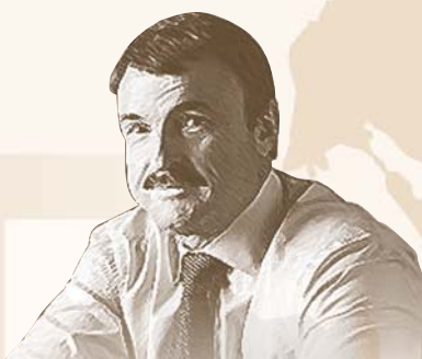
А.Г. Гурьев — вице президент Российского союза химиков, член Совета Федерации Федерального Собрания РФ

Международный год химии, в котором активное участие будет принимать и Российская Федерация, несомненно, станет мощным стимулом привлечения внимания общества к успехам химии. Контроль со стороны общественности способствует повышению безопасности химических производств, уменьшению их негативного воздействия на здоровье человека и окружающую среду.