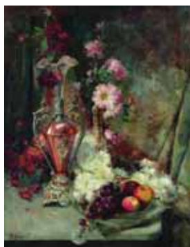
На 1-й с. обложки — репродукция картины К.Е. Маковского «Натюрморт», 1890-е гг.