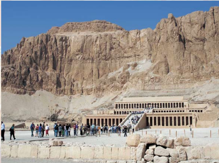
Гробница царицы Хатшепсут