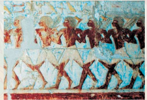
Фрески в гробнице Хатшепсут ↑↓