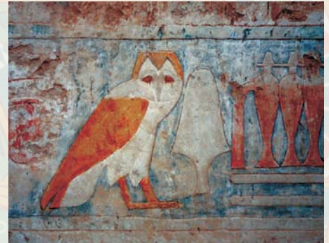
Фреска с изображением богини неба Хатхор ↓