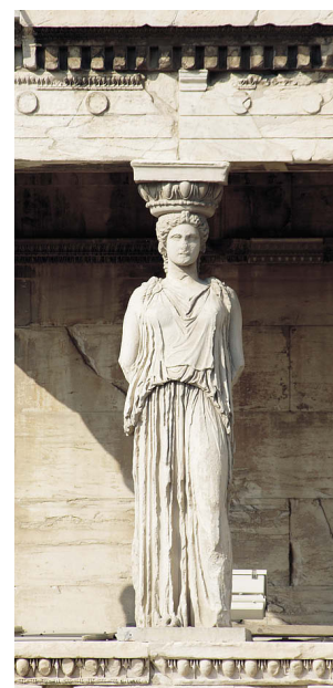
Статуя портика кариатид

ца высек ручей, а Афина посадила оливу. Восточная часть храма была посвящена Афине, а на 12 ступеней ниже находилось святилище Посейдона. Особенно величественный вид придавали Эрехтейону портики: восточный с 6 и северный с 4 ионическими колоннами. С южной стороны фасад украшает маленькая пристройка, поддерживаемая 6 мраморными кариатидами. В последующие века, с распространением христианства, постройки Акрополя были частично разрушены. Наибольший ущерб Парфенону причинил взрыв хранившегося там пороха в 1687 году. И лишь после обретения Грецией независимости начались реставрационные работы, продолжающиеся по сей день.